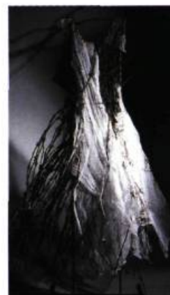
Scarecrow , 1987 Fil barbelé, gaze, rouille, acier 152 X 67 X 40 cm

squelettes de verre dont l'ombre se dessine au mur. Selon l'artiste, cette installation se veut un regard sur le monde via un télescope – l'infiniment grand dans l'infiniment petit – ou encore, une observation microscopique d'une chaîne d'ADN grossie: «l'infiniment petit écrit très grand».