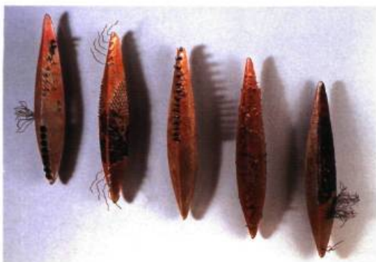
From the One, 1994 de la série La Semence installation murale de 20 éléments verre coulé dans le sable et poli, cuivre, acier 2 X 2,6 m chaque élément : 53 X 11 X 7 cm

D' OÙ VENONS-NOUS ? OÙ ALLONS-NOUS ? NOUS NOUS SOMMES TOUS, UN JOUR OU L'AUTRE, INTERROGÉS SUR CES INÉLUCTABLES QUESTIONS EXISTENTIELLES AVEC PLUS OU MOINS D'INSISTANCE. SUSAN EDGERLEY EN A FAIT SON LEITMOTIF. ELLE S'INTERROGE, DEPUIS QUINZE ANS, SUR LE SENS DE L'EXISTENCE, LA FRAGILITÉ DE L'ÊTRE, LE PASSAGE DU TEMPS ET LE CYCLE DE LA VIE, BREF, SE NOURRIT D'ÉVÉNEMENTS POUR MIEUX INSCRIRE SES ÉMOTIONS DANS LA MATIÈRE.