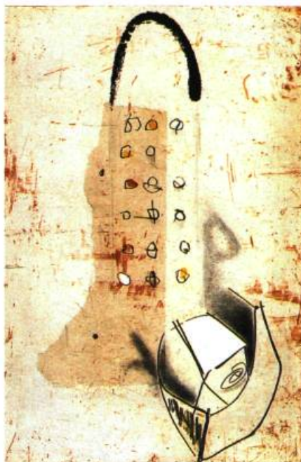
Réclusion, 1998 Eau forte, pointe sèche, chine collée 75 x 55 cm Coll. Banque nationale du Canada

Lorsque j'observe Distance 1 , j'ai l'impression de pénétrer dans cette œuvre par une porte d'azur qui dérive sur un lac, endeuillé par le crépuscule. Dans la transparence du lointain, on aperçoit une nappe crémeuse qu'un souffle de noir recouvre. Ici et là, des joncs déjà morts flottent sur la surface douce d'un bleu fin d'automne. Distance 2 nous ramène à cette noirceur qui s'écrit sur une tendre mer blanche près de laquelle ondoie une mare hasardée, voire roussâtre. Près de cet étang où l'œil se perd dans des mirages de cerise et de rose, Distance 3 me fait penser à un haikai ,