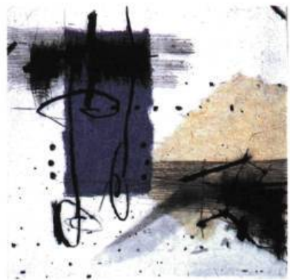
Quête 1 , 1998 Pointe sèche et chine collé 55,5 x 64 cm

Réclusion fait appel à un imaginaire et à une transposition fort différents. Ayant fait un récent séjour à Paris, l'artiste fut très frappée par la Tour Saint-Jacques dont on se souviendra qu'elle fut construite de 1508 à 1522. Seul vestige de l'église édifiée au XVI e siècle sur le chemin des pèlerins de Saint-Jacques de Compostelle, cette tour de style gothique représente non seulement les ruines d'une mémoire ridée par le temps, mais évoque la fragile pérennité de tout geste humain. Qui regarde Réclusion , reconnaît cet élan de verticalité parsemée d'infimes