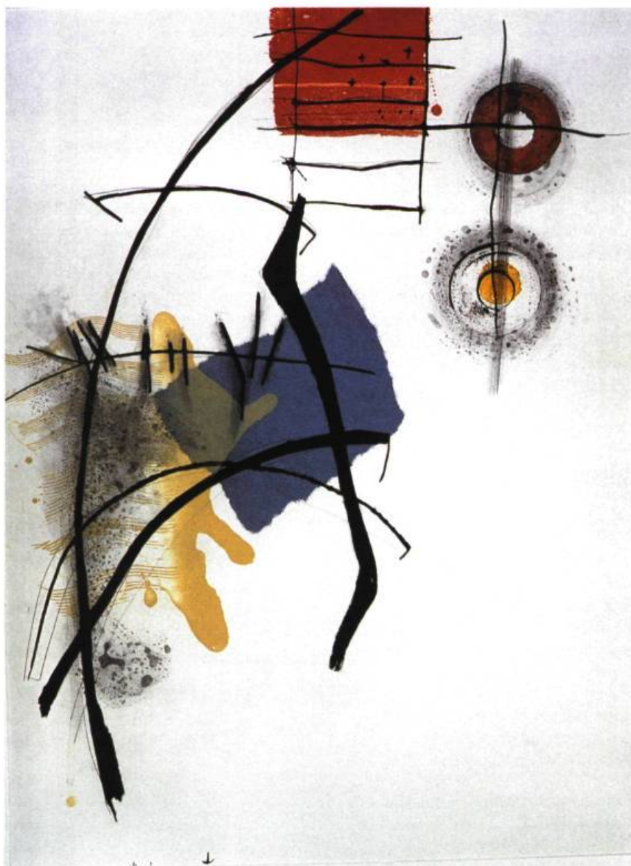
Rives, 1998 Pointe sèche, aquarelle et chine collé 55,5 x 78,5 cm

L ISA TOGNON TRACE DANS SES GRAVURES LA SÉDUCTION QUE LUI INSPIRE LA MATIÈRE ET LES SIGNES QUI LUI RENVOIENT DES INSTANTS DE VIE.