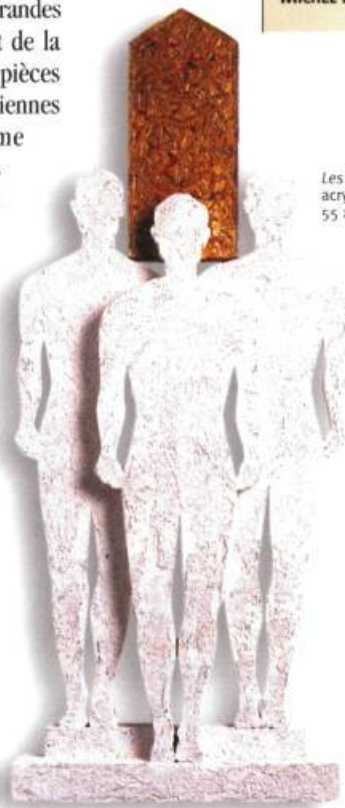
Les pourvoyeurs 3, 1999 acrylique, bois, feuille d'or, 55 x 23 x 4 cm

NORMAND MOFFAT, MEMBRE DU CONSEIL DE LA SCULPTURE DU QUÉBEC, A FAIT DES ÉTUDES À L'ÉCOLE DES BEAUX-ARTS DE MONTRÉAL PUIS IL A OBTENU UN BACCALAURÉAT EN ARTS PLASTIQUES DE L'UNIVERSITÉ DU QUÉBEC À MONTRÉAL. SES ŒUVRES ONT ÉTÉ ACQUISES PAR LE MUSÉE DE LACHINE, L'UNIVERSITÉ DU QUÉBEC À MONTRÉAL ET LA COLLECTION PRÊT D'ŒUVRES D'ART DU MUSÉE DU QUÉBEC. DE NOMBREUSES EXPOSITIONS INDIVIDUELLES ET COLLECTIVES ONT ÉMAILLÉ SA CARRIÈRE DEPUIS 1972. ON PEUT VOIR UNE DE SES MURALES À LA STATION SAINT-MICHEL DU MÉTRO DE MONTRÉAL.