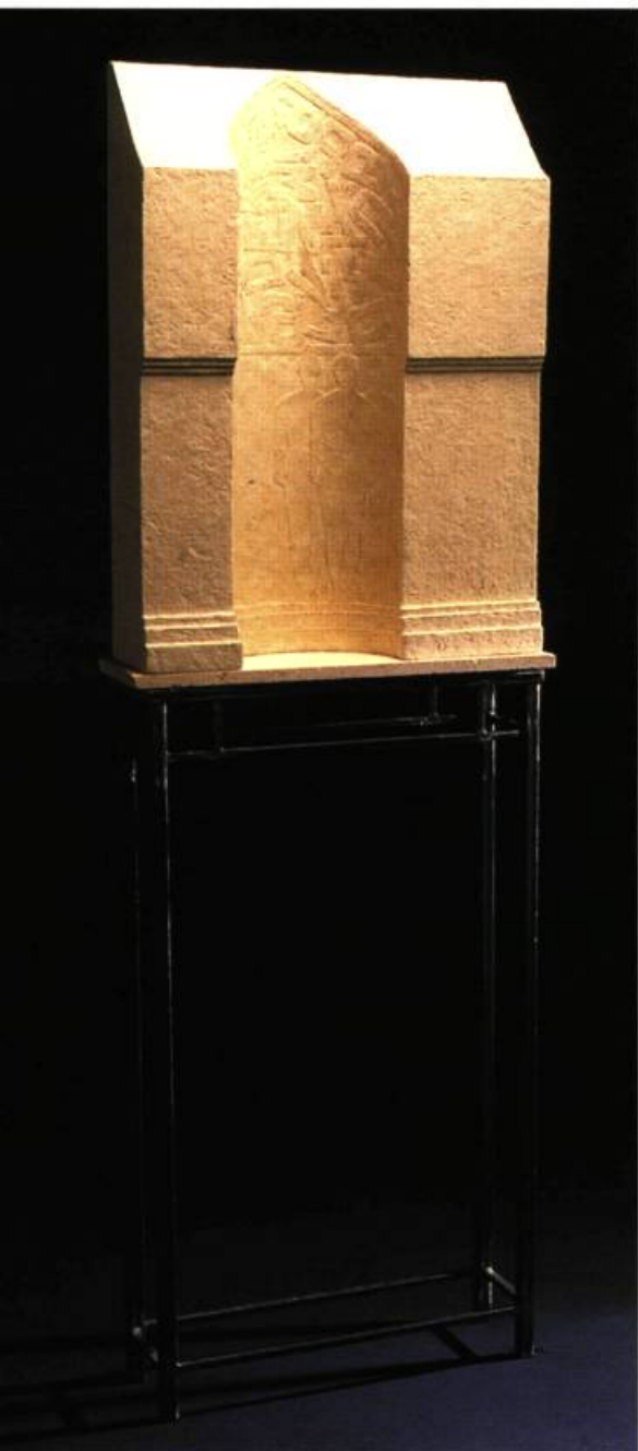
Les gardiens du savoir , 1998 techniques mixtes, 200 x 70 x 20 cm

IL CHOISIT DES MATÉRIAUX PEU COMMUNS OU SANS GRANDE VALEUR INTRINSÈQUE.