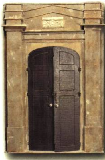
Raymond, Richard Hôtel Montréal: Éditions Incipit, 1988

Délégation générale du Québec à Bruxelles