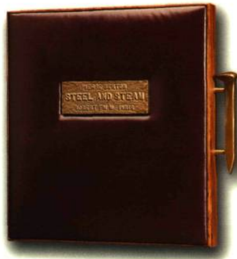
Berton, Pierre Steel and Steam Outremont: Laurier & St-James, 1985

Son premier atelier, Pierre Ouvrard le créa, en 1949 avec Marcel Beaudoin, à Montréal, lieu où furent reliés des milliers de volumes pour les commissions scolaires