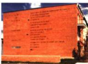
Tango de Montréal (1999)