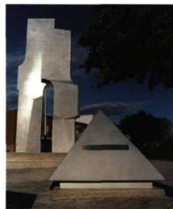
Yves Trudeau Parvis et portail #22 Place de l'an 2000 Ville saint-Laurent

L'artiste bien connu Yves Trudeau vient réaliser la Place de l'an 2000 , un ensemble sculptural destiné