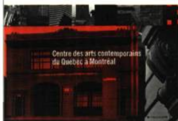
Couverture de la monographie