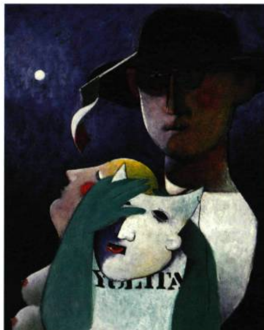
Sayulita Man 1992 16 x 12 po. Huile