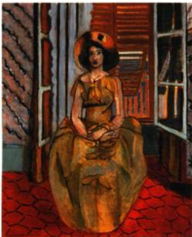
Robe jaune, 1929-1931 Huile sur toile 99,7 x 80,7 cm