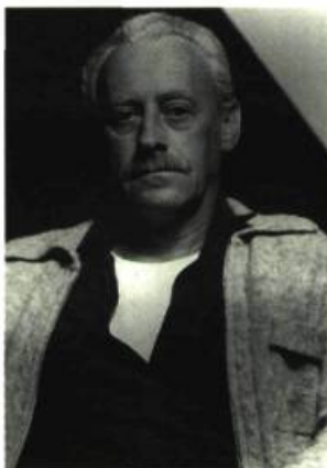
Yves Gaucher

Yves Gaucher, l'une des figures les plus marquantes de l'abstraction géométrique, s'est éteint le 8 septembre 2000 à Montréal. L'artiste avait conquis une notoriété internationale en produisant En hommage à Webern (1963), une suite de gravures aux éléments particulièrement épurés. Cette série que l'on peut considérer comme une transposition visuelle des rapports sons/silence du musicien Anton Webern avait surclassé sur le plan du dépouillement les propriétés des rapports ligne, forme/surface qu'exploitaient alors les artistes américains. Toute sa vie, Yves Gaucher s'est consacré à l'étude des variations chromatiques dont les écarts se situent à la limite de la perception de l'œil humain. Il a fait preuve à cette fin d'une économie