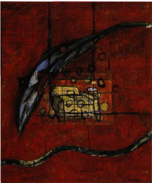
Coin rouge , 1999 Acrylique sur toile, 100 x 81 cm

HORACIO SAPERE EST NÉ EN 1951, À BUENOS AIRES EN ARGENTINE, DIPLOMÉ DE L'ÉCOLE NATIONALE DES ARTS DE BUENOS AIRES (1973). IL S'INSTALLE À PALMA DE MAJORQUE EN 1974. À PARTIR DE 1986 SA CARRIÈRE DEVIENT INTERNATIONALE. IL PREND PART AUX GRANDES FOIRES (CHICAGO, COLOGNE, BALE...). IL EXPOSE DANS LES GRANDES VILLES EUROPÉENNES (AMSTERDAM, VIENNE, LONDRES, STOCKHOLM) PUIS AUX ÉTATS-UNIS (WASHINGTON, NEW YORK). INVITÉ D'HONNEUR AU SYMPOSIUM INTERNATIONAL DE LA JEUNE PEINTURE DU CANADA (BAIE ST-PAUL, 1993), IL TROUVE À LA GALERIE ÉRIC DEVLIN À MONTRÉAL, UN PORT D'ATTACHE AVEC LE QUÉBEC OÙ IL PRÉSENTE RÉGULIÈREMENT SES PRODUCTIONS.