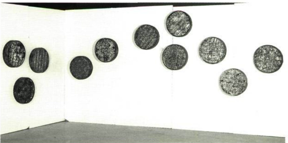
Denis Routhier Today will be better than yesterday Tomorrow will be better than today Acrylique sur tissu industriel 183 x 136 cm

Charles Pachter, lui, capture le réel du paysage en réduisant les formes à des schémas emblématiques pour en retenir toute la puissance d'évocation et surtout une signification différente.