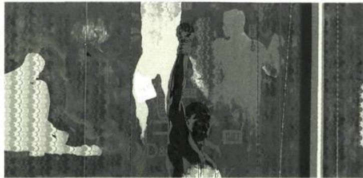
Richard Conte Mon inconscient chinois Peinture/sculpture des 11 tamis chinois, 2001 Acrylique et bambou 11 x 45 cm de diam.

Il faut signaler d'emblée la grande qualité d'exécution des œuvres réalisées. L'assurance et la maturité étonnante des artistes sont venues prouver que le talent n'attend pas le nombre des années. Certes, à quelques exceptions près, l'approche technique est demeurée conventionnelle. Elle a été mise à profit par la plupart des artistes pour cerner le