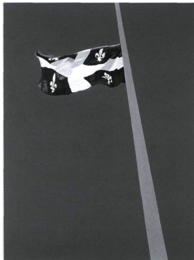
Charles Pachter Drapeau dans le vent Acrylique sur toile 210 x 150 cm