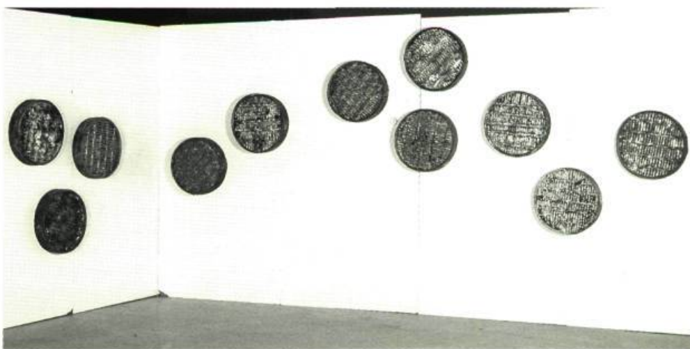
Denis Routhier Today will be better than yesterday Tomorrow will be better than today Acrylique sur tissu industriel 183 x 136 cm

Charles Pachter, lui, capture le réel du paysage en réduisant les formes à des schémas emblématiques pour en retenir toute la puissance d'évocation et surtout une signification différente.