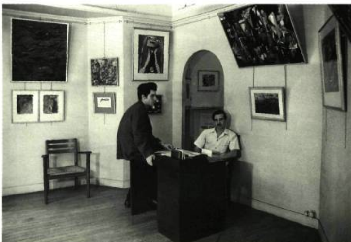
Jean-Paul Riopelle et Fernand Leduc Galerie du Luxembourg Paris, 1947