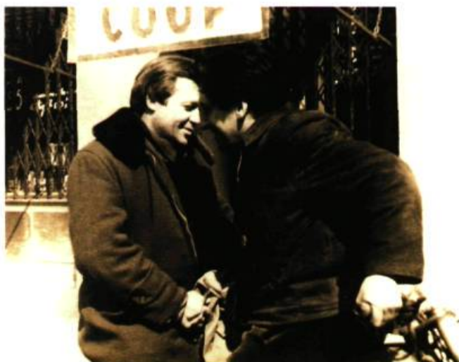
Jean-Paul Riopelle en compagnie de Sam Francis Paris, 1956