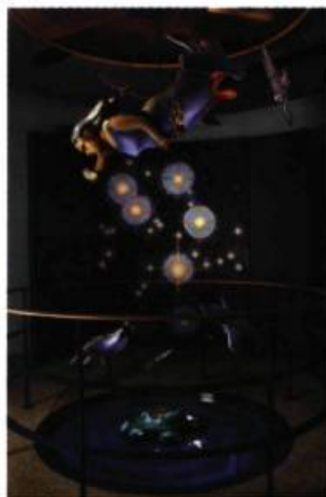
La Femme du Ciel Installation de l'artiste Shelly Niro

Les peuples autochtones du Canada n'occupent pas toujours la place qui leur revient dans les institutions culturelles du pays. Le Musée canadien de la civilisation contribue à changer cette situation en inaugurant la salle des Premiers peuples,