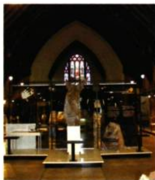
Musée des maîtres et artisans du Québec