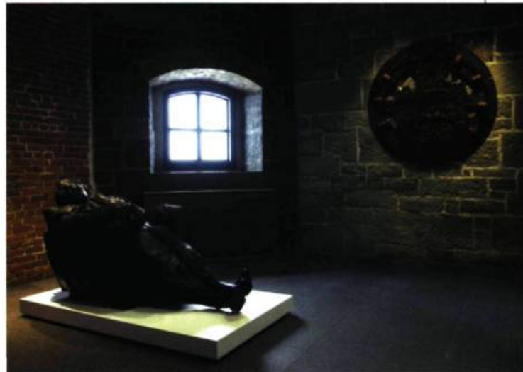
Salle Riopelle – Loto-Québec

Ainsi, la salle Riopelle – Loto-Québec , située au 4 e étage du pavillon Charles-Baillairgé, est consacrée à des œuvres importantes de l'artiste et met également en scène deux bronzes acquis par le musée en 2002, soit Le Grand Fauteuil , portrait grandeur nature de Riopelle réalisé par Roseline Granet et Hibou accompagné (1970), un relief de la main du grand maître datant de 1970. Cette initiative se veut à la fois un hommage à Riopelle et une occasion de découvrir son œuvre dans une ambiance à la fois intime et familière.