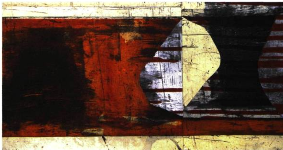
Persimmon Print 4 Monotype, 2002 77 x 159 cm

L ES ŒUVRES RÉCENTES DE CATHERINE FARISH NE SE DONNENT PAS D'EMBLÉE COMME DES COLLAGES MAIS PLUTÔT COMME D'AMPLES GRAVURES, GÉNÉRALEMENT DES COLLAGRAPHIES. LEUR FORMAT EST SI GRAND D'AILLEURS QU'ELLES RÉSULTENT RAREMENT D'UNE IMPRESSION UNIQUE. ELLES PROVIENNENT LE PLUS SOUVENT, EN EFFET, DE PLUSIEURS PASSAGES SOUS LA PRESSE. IL SERAIT DONC PLUS JUSTE DE LES QUALIFIER D'ASSEMBLAGES DE GRAVURES ; LES CONSIDÉRER COMME DES ARRANGEMENTS DE PLANS CONVIENTRAIT PROBABLEMENT MIEUX ; ET MIEUX ENCORE SERAIT DE LES APPRÉHENDER COMME DES AMÉNAGEMENTS DANS LE SENS QUE L'ON PRÊTE À CE TERME QUAND ON L'APPLIQUE À UN TERRITOIRE.