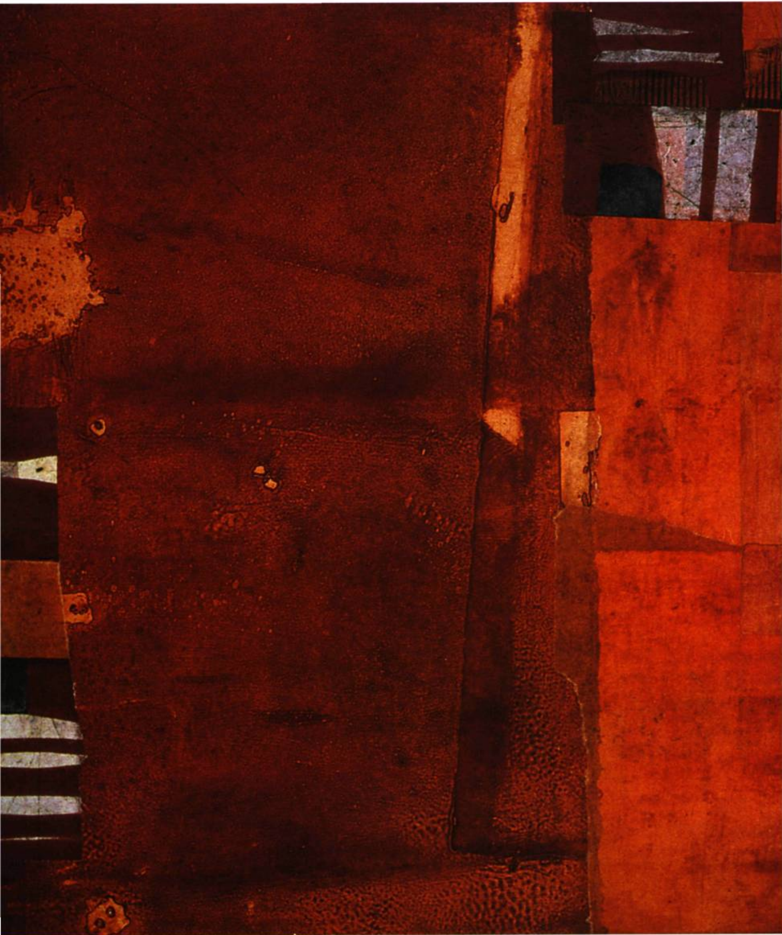
Persimmon Print 6 Monotype, 2001 36" x 63"