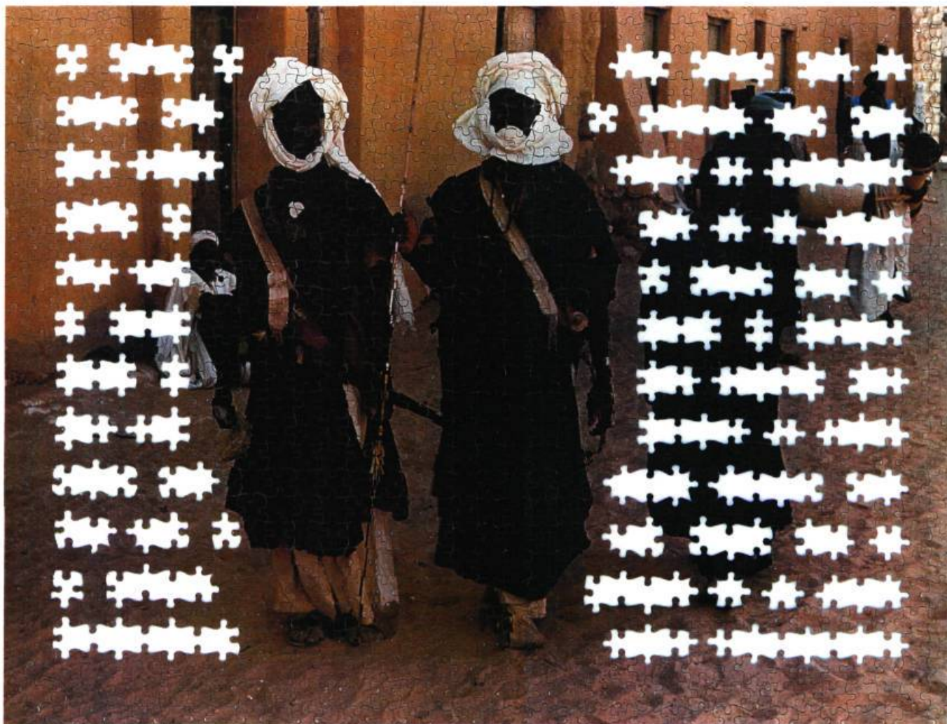
Sans titre ( Tribesmen Timbuktu ), 1977-1995 Casse-tête Parker Brothers Ltd 55 x 70 cm