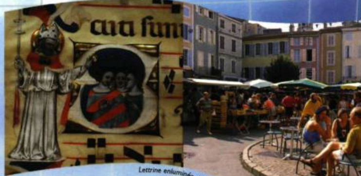
Lettrine enluminée d'un antiphonaire du XVI e siècle • Marché vu de Bouv...

La maison de poupée, née en Allemagne au XVII e siècle, trouve aussi sa place au musée avec meubles et objets à l'échelle du 1/112 e . Enfin, les micro-miniatures, performances nécessitant le recours à une loupe très puissante pour les observer (exemple : 12 chameaux en or dans le chas d'une aiguille de taille normale), fascinent les visiteurs. Les expositions temporaires développent un aspect particulier de cet univers constitué d'œuvres d'art aussi petites que nombreuses. Au programme de cette année, Art miniature contemporain , avec les œuvres primées et sélectionnées de la BIAM de Ville-Marie. En projet pour 2007 : Le bestiaire de Pellan , en collaboration avec le Musée national des beaux-arts du Québec.