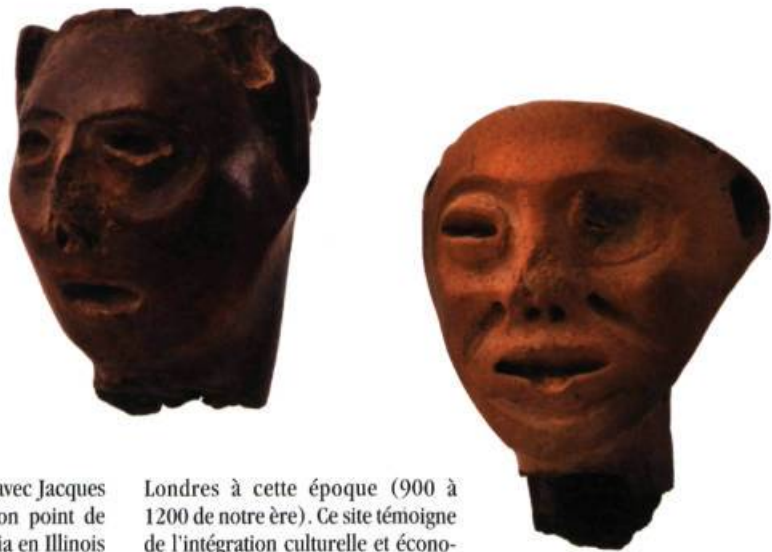
Pipes à masques Site Glenbrook, Ontario Musée canadien des civilisations, Gatineau

du peuple du maïs, il est décevant de constater le peu d'espace consacré dans les salles du Musée à la route du maïs . Pourtant, une piste de compréhension évoquée dans le livre-catalogue signé Roland Tremblay aurait permis de comprendre les Iroquoiens dans leur contexte continental plutôt que