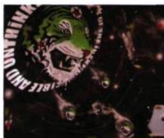
Sylvain Bouthillette Dharma Bum All Part of the Inexpressible and Unthinkable, 2005 Huile, peinture en aérosol et craie sur bois, 230 x 244 cm

aérosols et il tient dans sa main droite une épée levée tandis que sa main gauche expose au regard du spectateur un livre ouvert sur lequel celui-ci peut lire: « il n'y a pas de souffrance ... ils sont devenus des bouddhas manifestes ... ». Sylvain Bouthillette écrit à nouveau Tout est parfait sous l'image d'un cerf qui s'effondre blessé à mort. L'homme qui veut être heureux doit se libérer de la peur. Bee brave , tel est le conseil que donne l'artiste, avec l'humour du jeu de mots, dans un grand tableau où des abeilles volent autour d'un chapeau de clown qui flotte sur un fond noir où est gravé à plusieurs reprises le nom du célèbre moine bouddhiste tibétain Milarepa. Or, s'il est une peur dont il est difficile de se débarrasser, c'est bien celle de la mort. L'artiste propose donc de considérer la vie