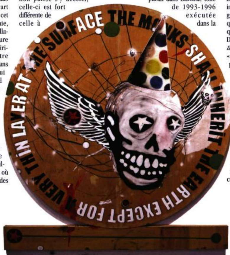
Sylvain Bouthillette RTH Except For, 2006 Huile, collage, fusain et peinture en aérosol sur bois, diamètre 210 cm

tradition de la bad painting new-yorkaise des années 70. Un nuage de peinture noire porte une inscription dépourvue de sens, « MABEU », tandis que des fleurs vertes se haussent vers un ciel invisible. L'artiste a donné à de nombreuses œuvres des titres qui parodient le vocabulaire de la liturgie catholique, tournant ainsi indirectement en dérision une religion fondée sur le dualisme du bien qui serait d'ordre spirituel et du mal qui aurait partie liée avec la matière. Dans Hail to the allmighty green tara, n° 4 , l'artiste emploie le mot « Hail », qui introduit en anglais la prière à la Vierge Marie, pour saluer la corneille dont l'omnipotence est rendue manifeste par sa taille démesurée. L'oiseau se découpe sur un fond jaune où apparaissent, écrits en « bad writing » (si l'on me permet l'expression), Tsong Khapa, nom d'un grand réformateur du XIV e siècle de la tradition monastique tibétaine. Dans Gyrocompas , un lièvre sculpté suspendu la tête en bas, tel un martyr, tourne au-dessus d'un cercle de métal sur lequel est gravé