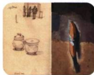
Carnet de croquis 1 , 2006 Estampe numérique 2/30 63 x 73 cm

Dans un parcours dont la mise en espace est inhabituelle grâce au travail de Gabriel Tsampalieros, collaborateur de François Vincent pour l'exposition Le peintre et son double , le visiteur découvre une quinzaine de tableaux accrochés, en retrait du mur sur des panneaux non rectangulaires déstabilisant le sens de la perspective. Artiste et professeur à l'École nationale de théâtre (ÉNT) depuis 25 ans, François Vincent a réalisé une série de diptyques, des gouaches vinyliques sur toile et sur panneau. En l'occurrence, de véritables livres ouverts, dont les doubles pages montrent d'un côté la recons-