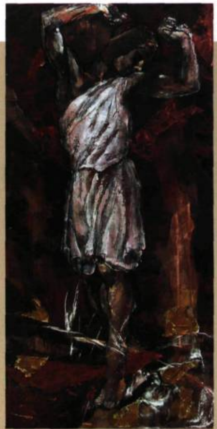
Svetla Velikova Narcisse I, 2007 Techniques mixtes sur toile 183 x 91 cm

Il nous laisse le troublant souvenir d'un être d'exception reconnu pour sa grande générosité, d'un virtuose de la danse d'un rare magnétisme, d'un chorégraphe génial, d'un homme au destin bouleversant qui par de nombreux aspects de sa carrière et de sa maladie peut nous aider aujourd'hui, à nous poser de fécondes questions sur la créativité et la santé mentale.