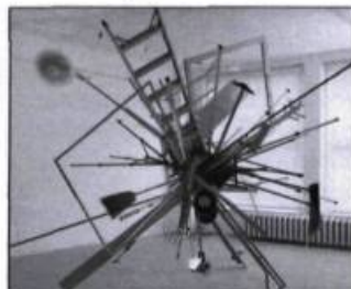
© Michael A. Robinson, Various studio essentials , 2004, médias mixtes, dimensions variables.

titution d'esquisses et de l'autre leur transformation sous la forme de peintures. Dans ces deux cas, l'artiste nous donne l'impression d'un inachèvement. Il simule – il théâtralise – le travail en cours dans l'atelier. Ses tableaux ne sont pas sans rappeler l'atmosphère qui se dégage des toiles de Giorgio Morandi, l'artiste italien dont les œuvres sont constituées d'objets quotidiens (bouteilles, lampes) reproduits sur des fonds unis, parfois un peu flous. François Vincent reprend souvent des formes qui rappellent des outils ou bien des matériaux de construction dans des positions incongrues ou encore qui flottent dans l'espace pictural sur des fonds indéfinis, ébauchés à coups de brosses. Une vidéo d'une dizaine de minutes permet de découvrir les premières traces de cette exposition en pénétrant dans le carnet de croquis de l'artiste que Gabriel Tsampalieros a eu la bonne idée de filmer page par page. MGB