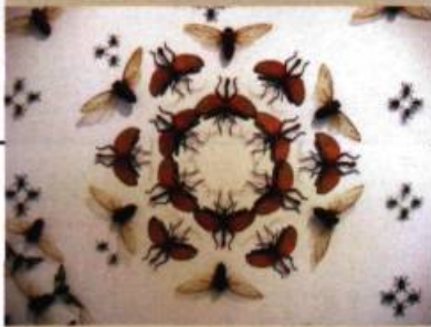
Jennifer Angus Chiyogami (détail) , 2004