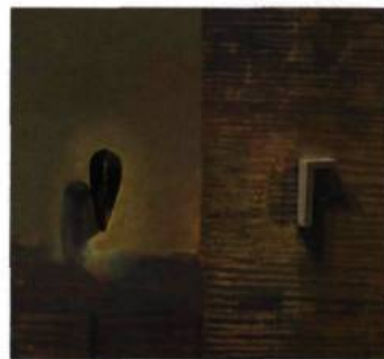
131006 , 2006, Gouache vinylique sur toile 107 x 114 cm