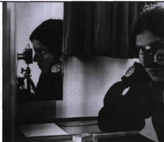
Ise Bing Autoportrait aux miroirs , Paris, 1931

D'autres artistes, fascinés par l'urbanité et l'architecture industrielle, multiplient les effets de cadrage et de perspective, privilégiant ici un gros plan sur l'infiniment petit ( Vilbrequin et pistons d'Anton Bruehl), cadrant là de vastes perspectives embrassant des points de vue inusités ( Le Pont George Washington de Margaret Bourke-White, 1933) ou encore offrant une multitude de points de vue dans une esthétique inspirée