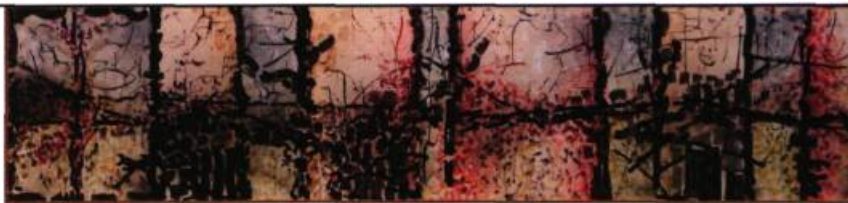
Sans titre, 1976 Encres de couleur sur papier marouffé sur toile 101,5 x 466 cm

À la fois abstrait et figuratif, entre Europe et Amérique, peintre et sculpteur, Riopelle apparaît dès lors comme un artiste du déplacement, du détournement. Avec ses métamorphoses et ses migrations, il se fait transbordeur, passeur, chaînon pour se partager entre plusieurs mondes. Pas étonnant que l'on retrouve ce résilient au tournant des années 70 si attentif et sensible au drame de l'exculturation et de la rupture dans la continuité d'une mémoire collective. L'œuvre Avion à flotteurs est l'une de ces Ficelles inspirées des figures inuites tracées avec de la corde dans l'espace ; elle fait partie de la suite exposée au Centre Culturel Canadien,