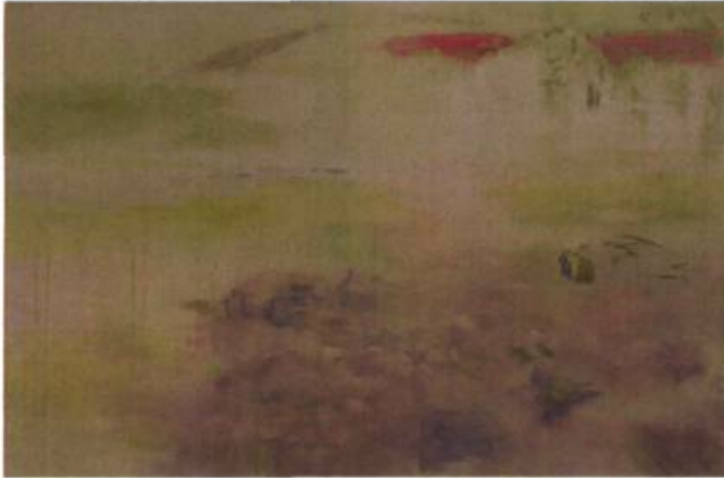
Iris, 2006 Huile sur toile 130 x 195 cm

Semin, critique d'art reconnu et ancien conservateur du Musée national d'art moderne Georges Pompidou.