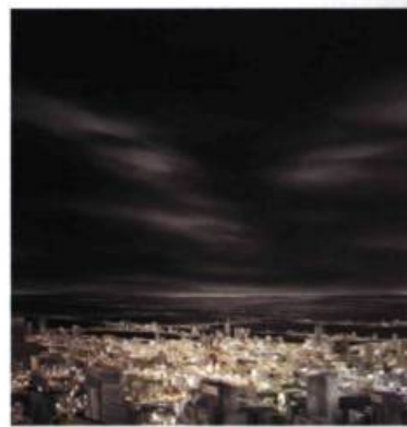
Glorious end of a nation Huile sur toile, 2007 183 x 183 cm

Reprenant à son compte l'allégorie des personnages figés dans le sable à Sodome et Gomorrhe, il vitrifie même les édifices de ses villes comme risquerait peut-être de le faire une déflagration nucléaire ( Études 1, 2, 3 ). Il faut reconnaître à Marc Nerbonne, jeune artiste de l'Outaouais, de bonnes qualités techniques. Il parvient avec habileté à créer des atmosphères troublantes. Par exemple, en dépit des nuages sombres qui les dominent et qui devraient les plonger dans l'obscurité, ses villes baignent dans une lumière dont l'artiste, subtilement, se garde de révéler la source, suscitant ainsi une seconde lecture possible. Ses ciels sont animés