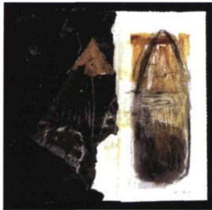
Je suis la promesse du vent, 2007 Médium mixte 30 x 30 cm