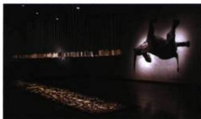
Le Cantique des créatures (détail), 2005 Techniques mixtes

texte, l'illustration ou, plus récemment, le cinéma d'animation. L'installation devient donc le lieu d'un paradoxe.