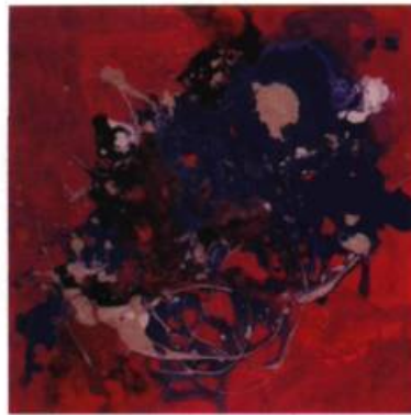
Sans titre Acrylique sur toile 61 x 61 cm

Je tente de transmettre sans interrompre un lot. Le premier jet est très spontané. Cela crée beaucoup d'effets de surprise. À partir de cela j'amène de nouveaux éléments. Utilisant l'acrylique fluide, Hélène Letourneau met en scène dans ses microcosmes autant de références au macrocosme. Ici les références géographiques s'associent à des courants océaniques évoluant à proximité d'étranges rivages. Cet univers aqueux transporte comme autant de continents des formes aussi scintillantes que transparentes. Entraînés comme par un courant, les motifs sont aussi évocateurs d'une