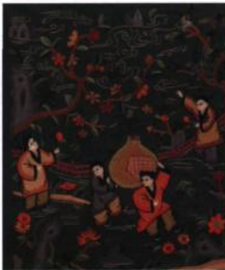
Panneau brodé Chine, province du Shanxi Fin XIX e -début du XX e siècle Soie brodée Collection Zhimei Zhang Musée du costume et du textile du Québec

On y trouve aussi bien des chaussures de lotus (pour les femmes aux pieds bandés), des panneaux d'oreillers que des bijoux et des accessoires. Parmi les vêtements