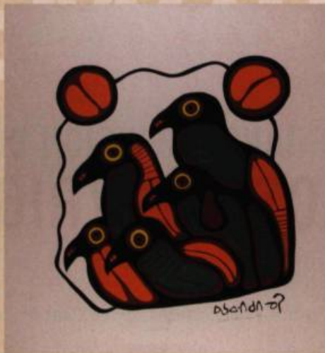
Norval Morisseau Cinq oiseaux bruns Estampe 104 x 96,5 cm Collection Musée canadien des civilisations, III-G-1268, D2003-18524