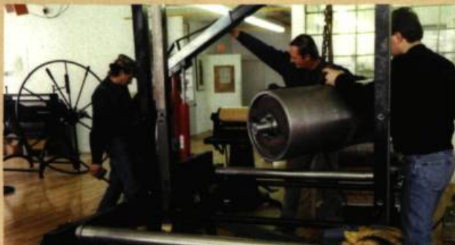
Atelier Circulaire Construction de la presse Hurel

Parmi les activités inscrites à la programmation du 25 e anniversaire de l'Atelier Circulaire pour l'année 2008, on relève :