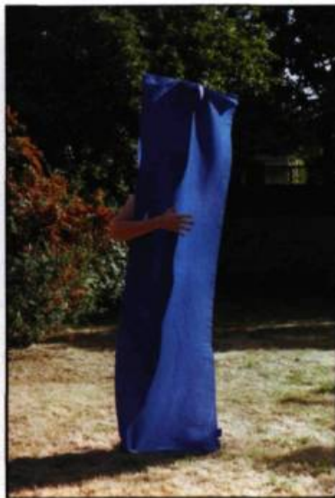
The Shadow Figures, 1978