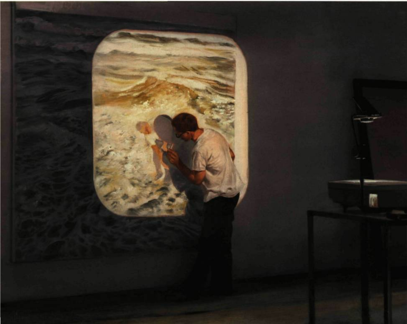
Dominique Gaucher Draw in No 2 , 2006 Huile sur toile H 45,5 x L 60,5 cm