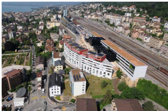
Figure 3. Vue aérienne du site depuis l'est avec au premier plan les institutions cantonales CMN-HEG. © Architecte : Bauart Architectes et Urbanistes SA.

pas intégré l'ensemble des concepts écologiques ambitionnés par les experts opérant sur le site. En particulier, en raison du désengagement des pouvoirs publics à subventionner l'intégration de technologies écologiques aux bâtiments, les opérateurs privés ont certes pris en compte cet aspect, mais dans la limite de ce que la réalité du marché leur permettait 10 .