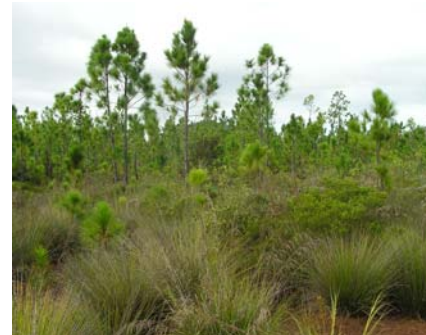
Figure 1. Invasion de Pinus caribaea sur des sols ultramaïfiques au sud de la Nouvelle-Calédonie.

L'effet direct de la température sur les invasions biologiques demeure controversé (Gabriel et al., 2001). Les modèles traditionnellement utilisés, basés sur les niches climatiques, font généralement apparaître des extensions des zones couvertes par les espèces invasives (Thuiller et al., 2007). De tels modèles présentent toutefois le défaut de faire abstraction d'autres facteurs de contrôle tels que la pression d'introduction, les conditions de milieu et les interactions avec communautés d'espèces en présence. Dukes et Mooney (1999) observent ainsi que le réchauffement climatique peut tout aussi bien conduire à une régression de l'aire occupée par certaines plantes invasives.