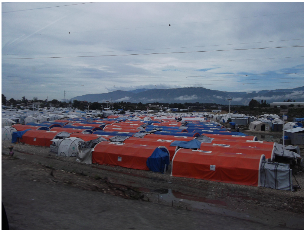
Figure 2. Un camp à la Croix des Bouquets

ou des organisations internationales (Carrefour, Croix des Bouquets) et présentent un plan au cordeau. Le quartier des familles sous les grandes tentes bleues se démarque de celui des ménages plus réduits qui occupent des tentes blanches de plus petite taille.