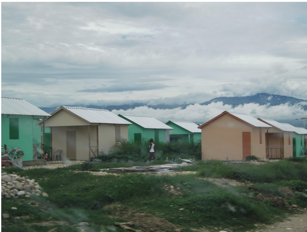
Figure 4. La partie ancienne de Camp Corail, déjà appropriée avec des jardins de case, juin 2011