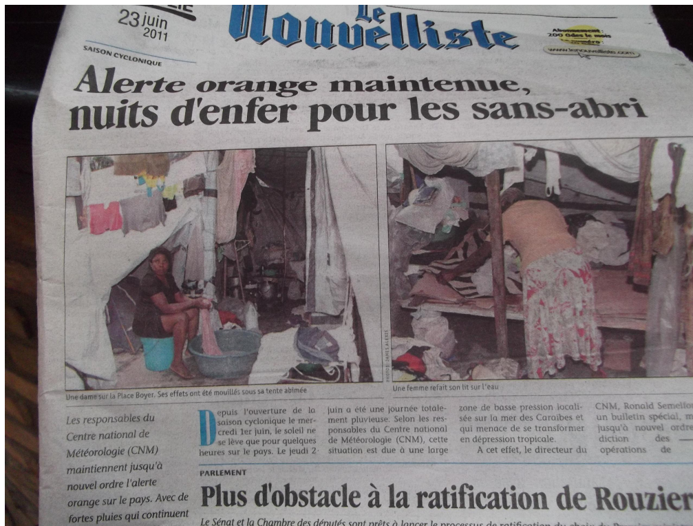
Figure 6. Nuit d'enfer après de fortes pluies en juin 2011, nuit ordinaire pour des milliers de sans-abris

connu une structuration collective dans un premier temps. Participer aux tâches nécessaires à la survie et à la salubrité du camp permet de sortir de l'apathie, pour ensuite se reconstruire dans la sphère privée une fois la recombinaison familiale effectuée. Le binôme antagoniste de l'espérance/déception étudié par Hirschman peut expliquer les réactions d' exit , voice , loyalty et apathie et leur hybridation (Hirschman, 1982). Cependant, l'apathie se manifeste quand, à chaque projet de quitter une tente de fortune pour un camp, puis vers un logement neuf, la déception est forte, le décalage étant parfois énorme entre la présentation du projet et sa réalité.