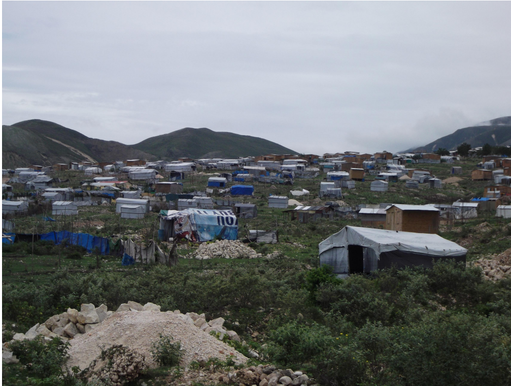
Figure 3. Camp spontané du piémont de la chaîne des Mattheux au nord de la plaine de Port-au-Prince