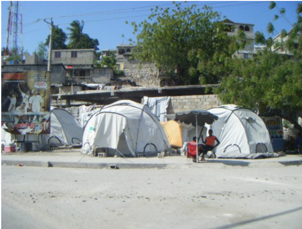
Figure 1. Quelques tentes de réfugiés en bordure de rue