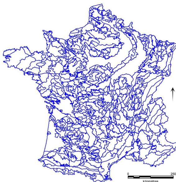
Figure 2. Les limnorégions de base (LR-2) en France continentale / The basic limnoregions (LR-2) in mainland France.

Territoires lenticques homogènes selon les cinq critères édictés : hydro-écorégion, potentiel d'accueil lenticque naturel, densité d'étangs, densités de mares, taille des étangs.