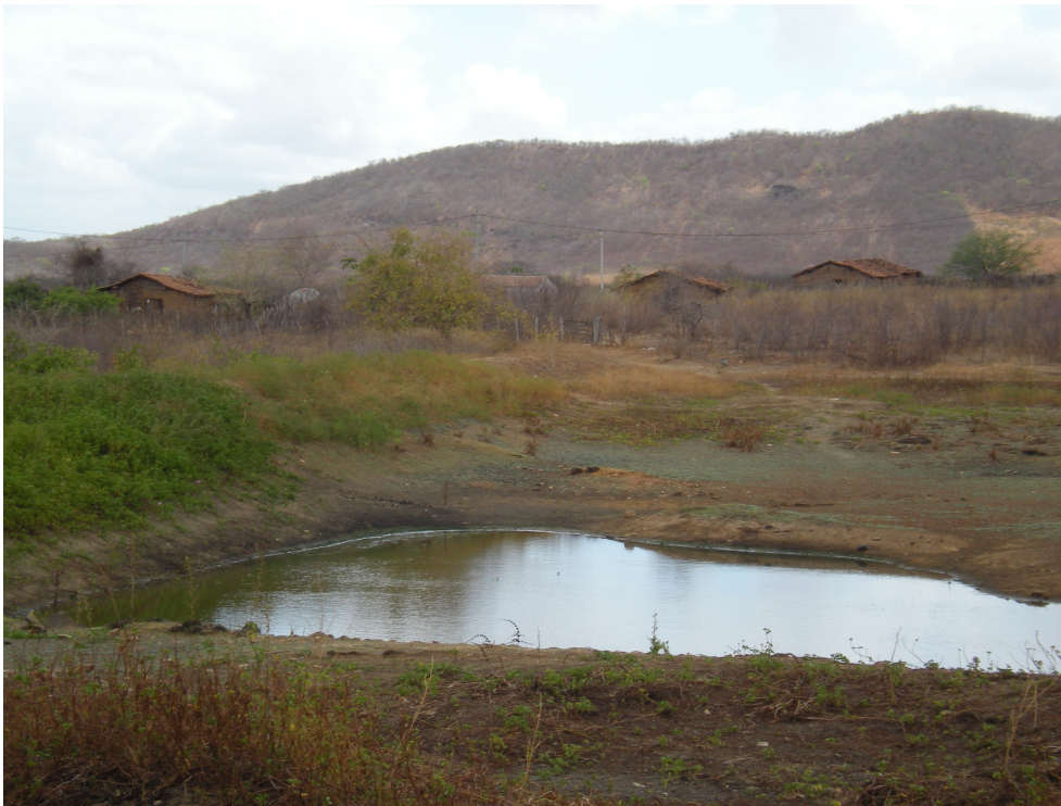
Figure 7. Retenue collinaire gérée par les membres d'une famille élargie habitant à proximité.