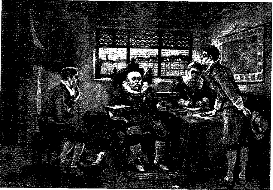
Jury littéraire délibérant sur les qualités respectives de deux ouvrages à primer. (... d'après G.H. Boughton, le Jugement de Wouter Van Twiller , reproduit dans l' Album de la Revue canadienne , Montréal, mars 1898).