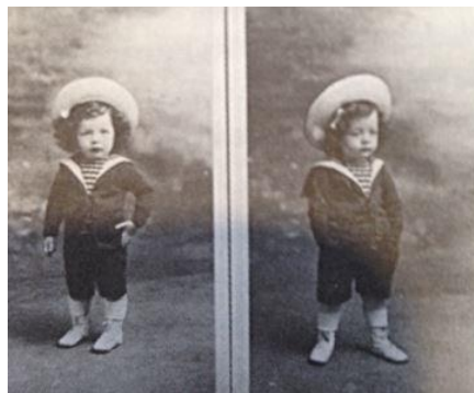
Figure 2. Photo de Willy Ronis de la collection personnelle de Colette Fellous. Image reproduite dans Un amour de frère , p. 21.

Considérons premièrement une photo d'époque d'un petit garçon en costume marin :