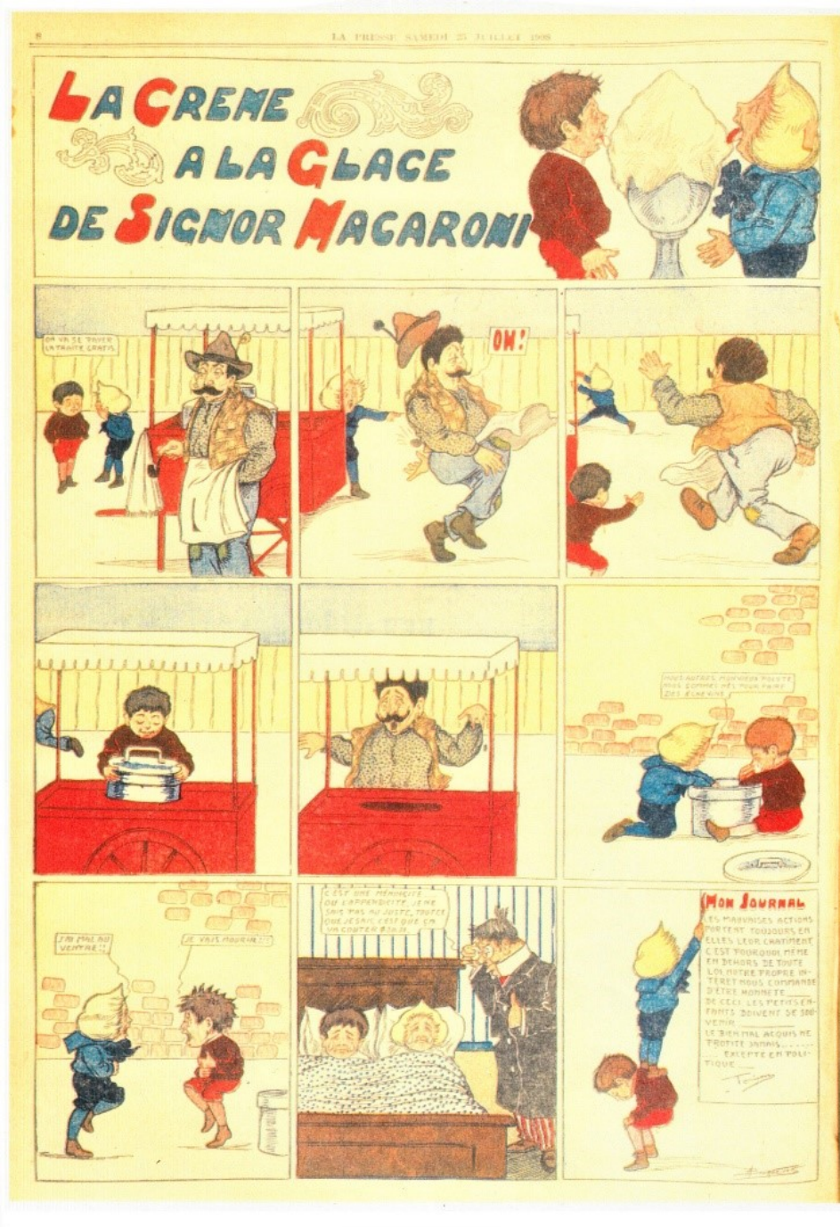
Albéric Bourgeois, La crème à la glace de Signor Macaroni. Les aventures de Toinon. La Presse, 25 juillet 1908

clichés subsistent, comme autant de témoins de la haute qualité artistique de ces œuvres oubliées.