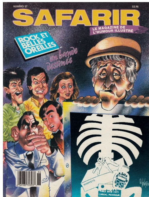
Page couverture, satire de l'émission télé de Radio-Canada « Rock et Belles Oreilles », Safarir 27, 1990.