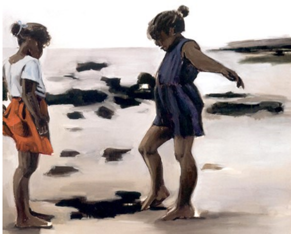
Image 1. Condor and the Mole , 2011

L'attraction de l'immensité océanique éveille en elle une source d'inspiration contemplative et interrogative, en synergie avec le personnage du tableau 8 Ever The Women Watchful , 2017 (Maidment et Schlieker 12). Il est vrai que l'océan, espace ouvert sur le monde, paraît parfois sombre, profond et angoissant. L'océan rappelle aussi la route des esclaves. Or, l'artiste ne pense pas uniquement à la couleur de l'océan mais surtout au mouvement de la lumière ou à la perte totale de celle-ci jusqu'à ce que tout s'obscurcisse à la surface de l'immensité aquatique. La tragédie de la nuit commence dans son atelier. Elle reste des heures à méditer sur l'exécution progressive de son travail avec les deux enfants qui jouent sur la plage.