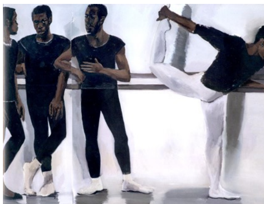
Image 2. A Concentration 2018

Il s'agit toujours de la pensée-peinture , pensée vagabonde, où circulent les flux imaginaires, par infiltration, à l'intérieur des lignes du dessin qui se développent dans la couleur. L'artiste ouvre la perspective d'une texture vivante, à la surface de la toile, où circule également, des flux sensoriels placés « au cœur des choses » (Husserl 59). Il faut alors retenir le geste du peintre, qui se concentre à l'intérieur des lignes et laisse venir du visible/fictionnel qui adhère au lieu-récit de soi.