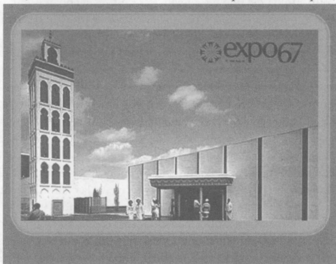
FIG. 3 : Pavillon du Maroc