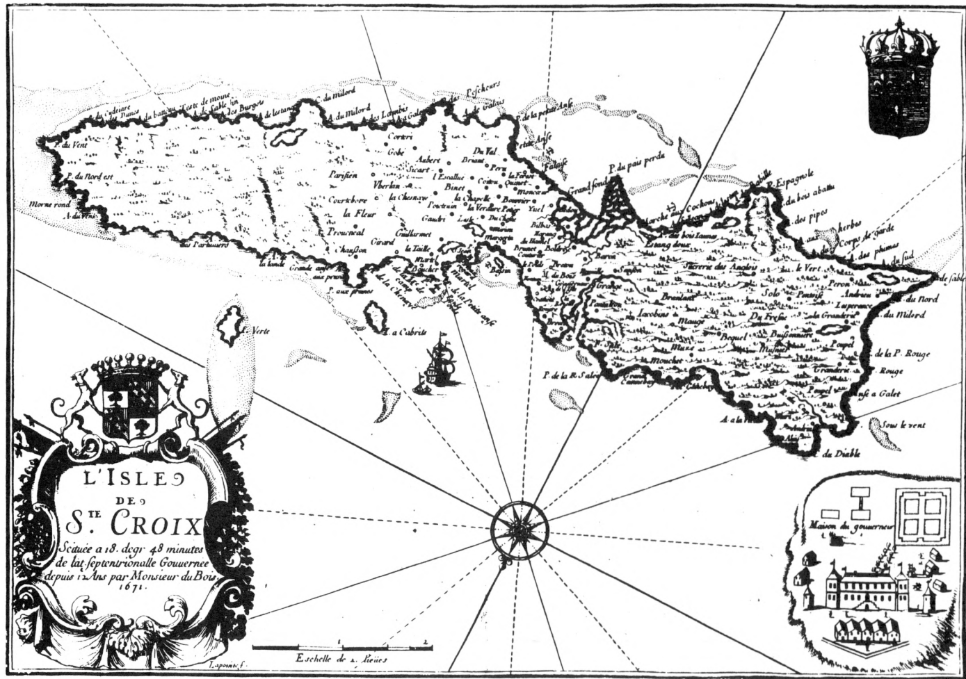
Carte de Sainte-Croix par le Sieur F. Lapointe, 1671 (Bibliothèque Nationale)