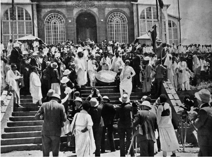
Fig. 1. La proclamation de la mobilisation générale à Addis-Abeba. Le ministre de la Plume lit le décret royal devant le tambour de Ménélik.