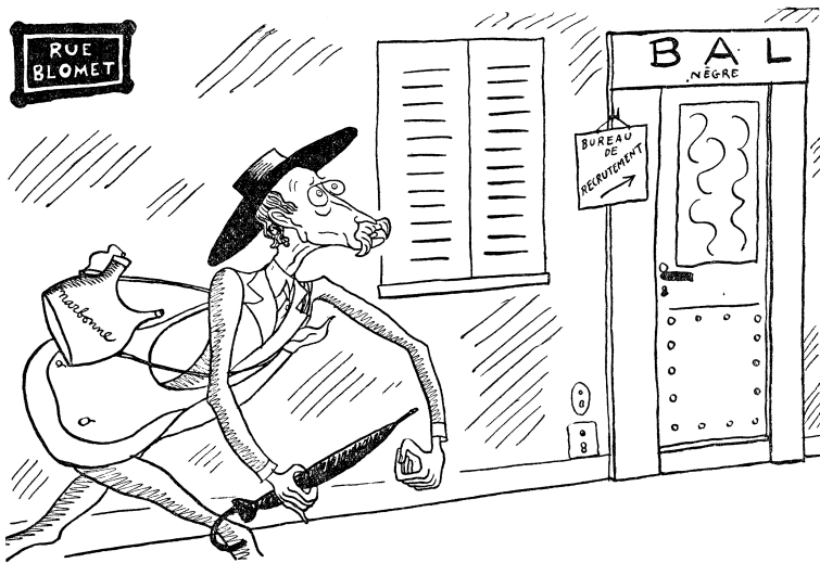
Léon Blum. — Je cours m'engager !...