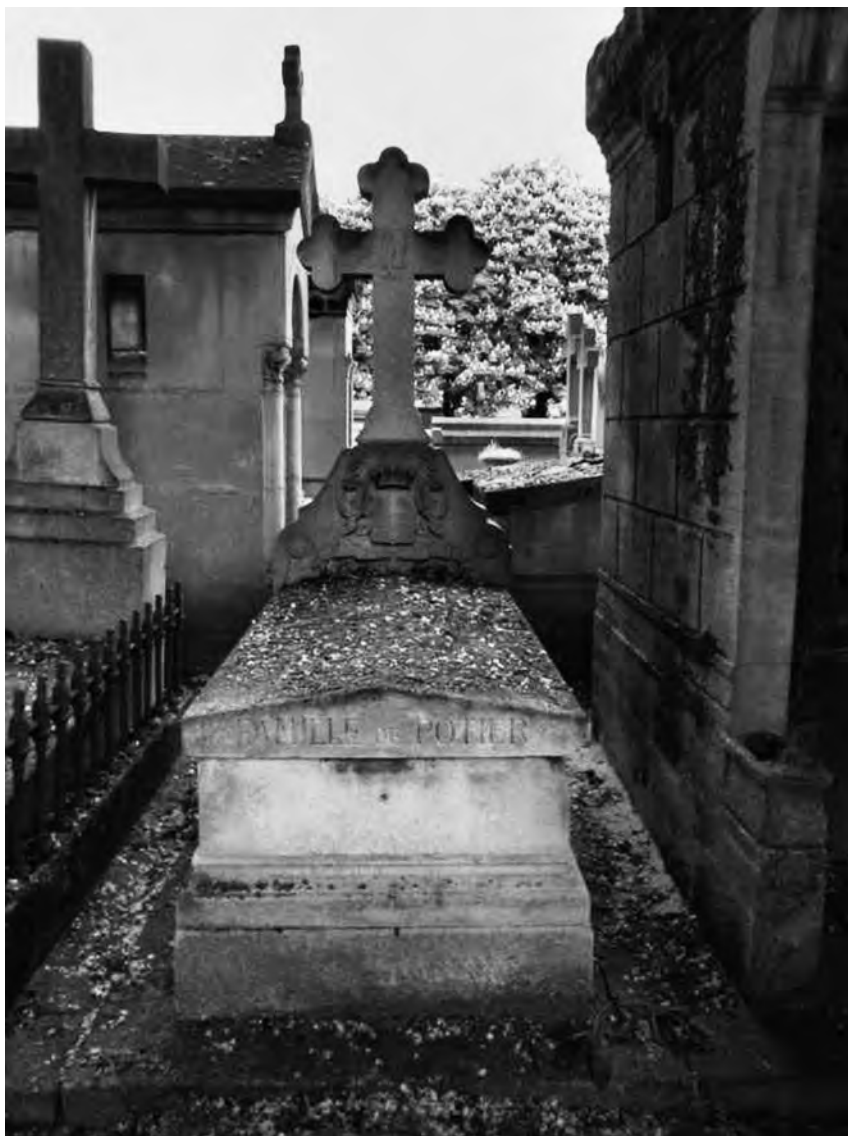
Fig. 21 – Cimetière du Père Lachaise. Concession de la famille de POTIER, 81 e division.