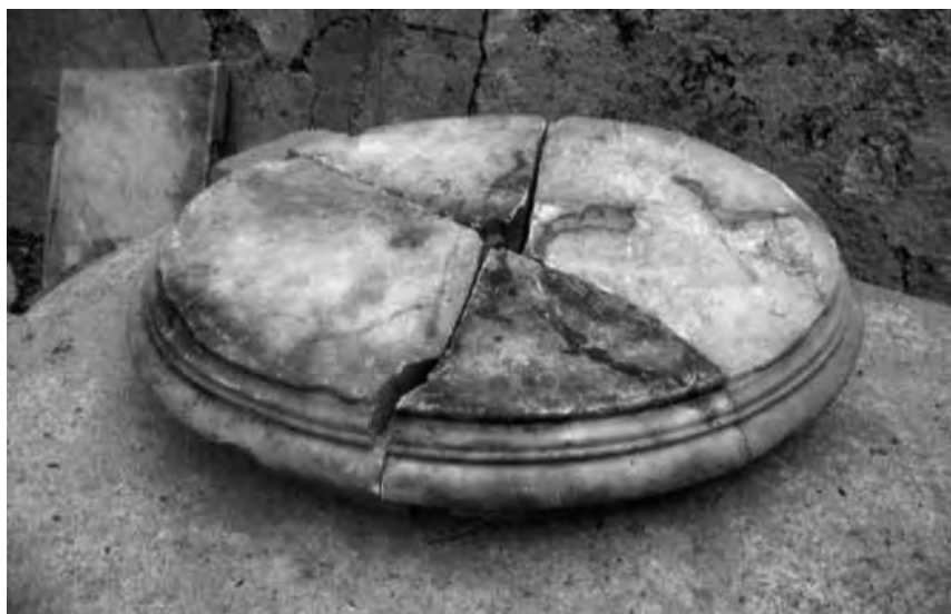
Fig. 17 – Pieds de colonne de forme ovale, en marbre. Les quatre éléments étaient dispersés dans tout le cimetière.