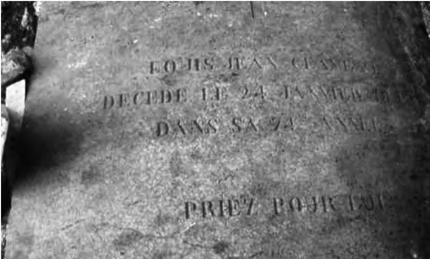
Fig. 9 – Enclos n° 1. Tombe de Louis Jean CLAVEAU, inscription.