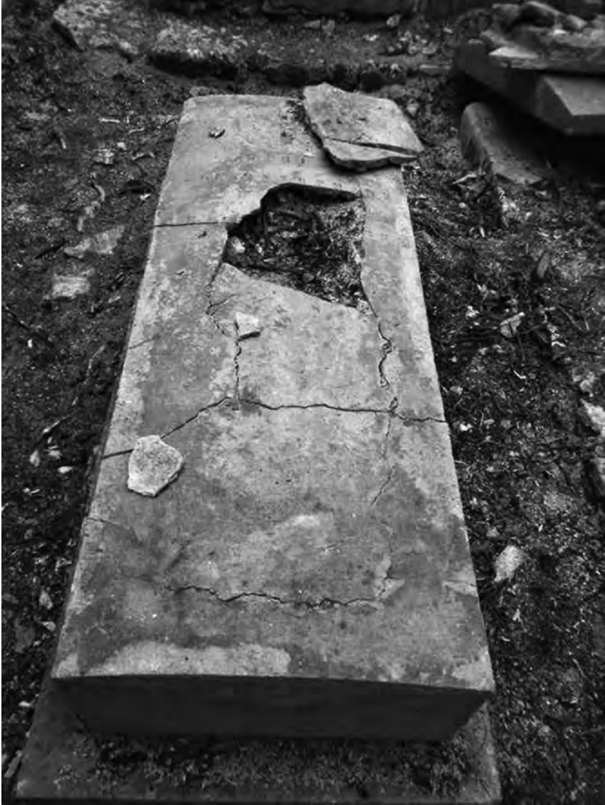
Fig. 11 – Enclos n° 1. Tombe d'un personnage inconnu. Malgré une inscription partielle, le personnage n'a pas été identifié