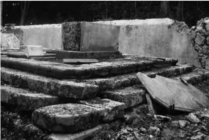
Fig. 5 – Enclos n° 1. Tombe de Silvestre LOMBARD. À droite, la plaque qui reposait sur le monument.