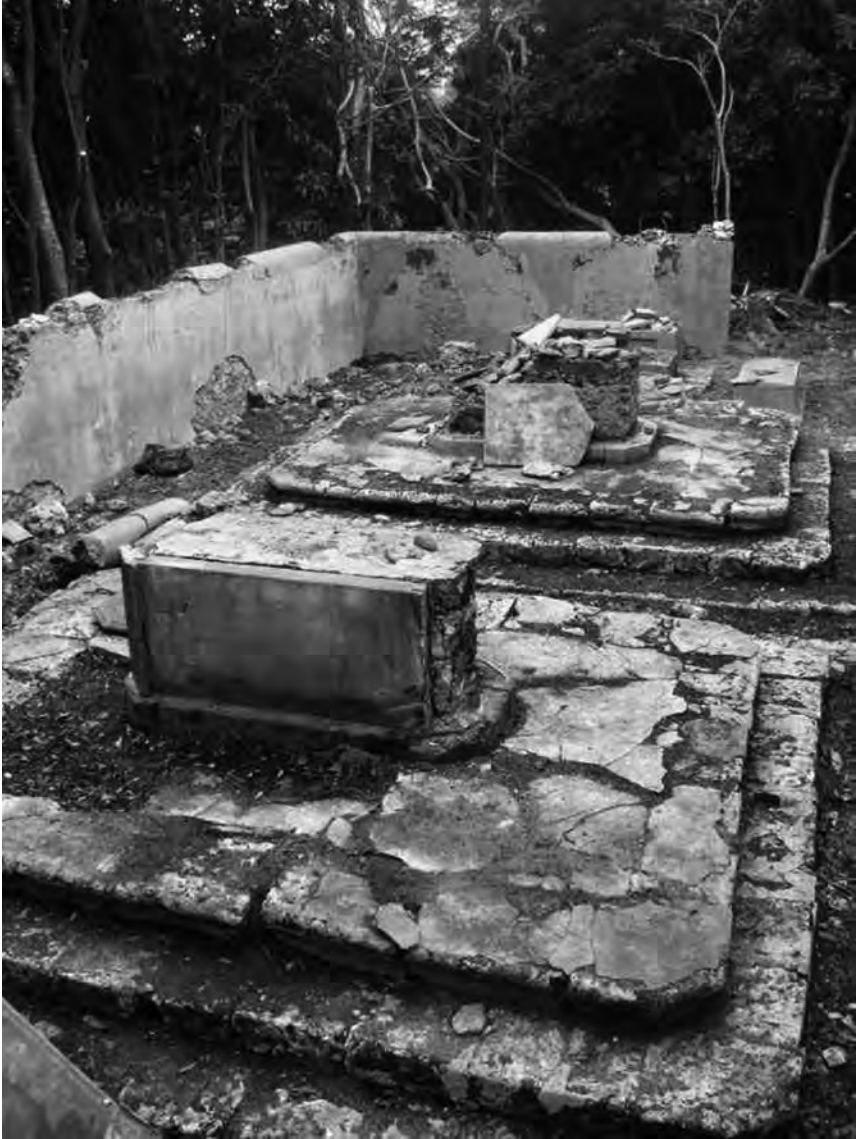
Fig. 3 – Vue générale de l'enclos n° 1 depuis le nord. Au premier plan, la tombe de Silvestre LOMBARD.