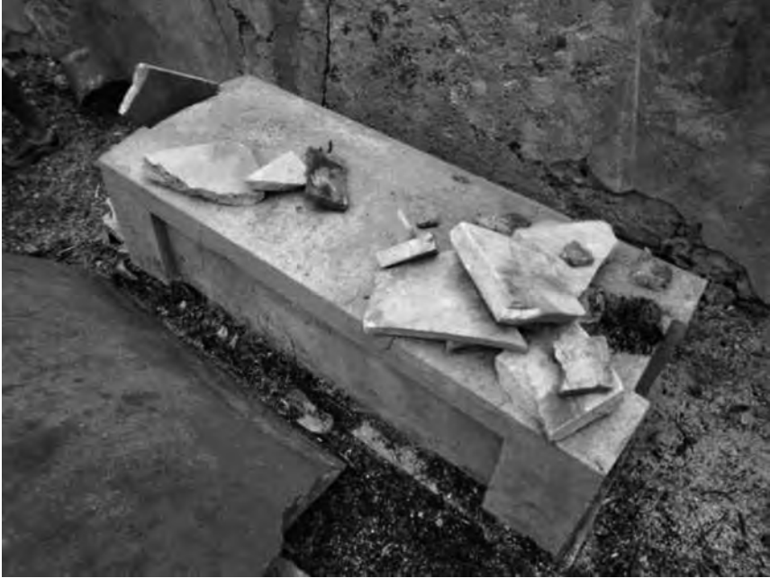
Fig. 10 – Enclos n° 1. Tombe d'un personnage inconnu. Il pourrait s'agir de la sépulture d'Émile DEVILLE mort en 1892.