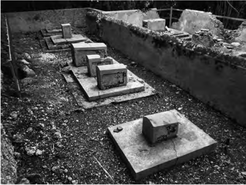
Fig. 4 – Vue générale de l'enclos n° 2 depuis le sud.