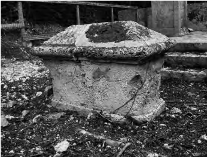
Fig. 13 – Enclos n° 2, tombe n° C. Personnage inconnu. Ce petit monument, aux formes atypiques, pourrait être celui de Théodore CLAVEAU, mort en bas âge en 1803 mais dont la dépouille aurait été transférée à Darboussier vers 1816/1817.