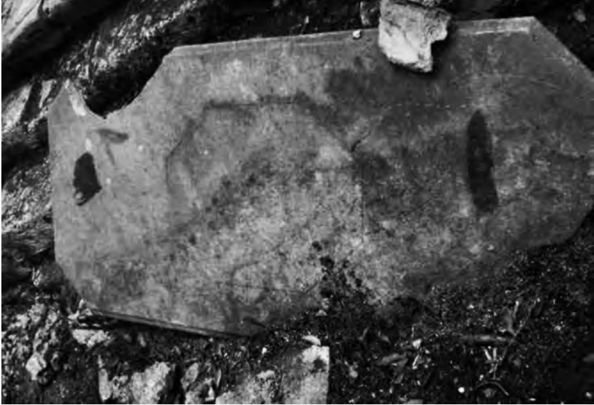
Fig. 18 – Dalle de forme octogonale allongée qui surmontait les monuments LOMBARD et CLAVEAU. On distingue nettement la trace d'une seconde dalle plus petite mais de même forme.