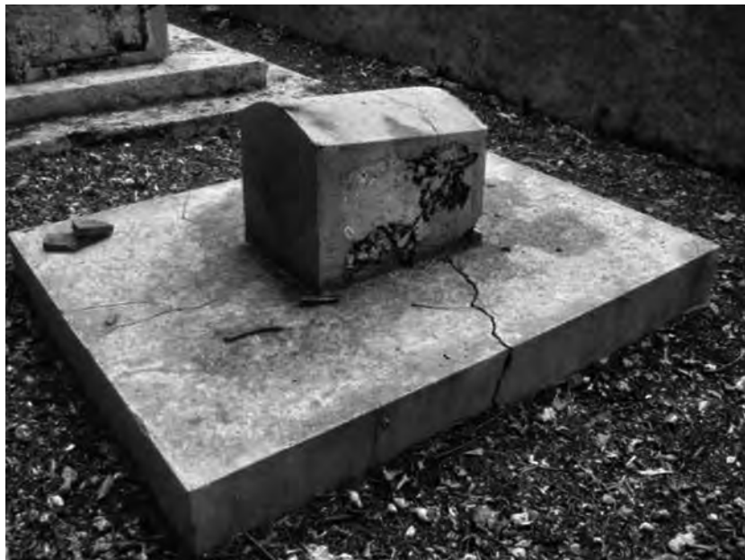
Fig. 16 – Enclos n° 2, tombe n° G. Personnage inconnu. La taille du monument laisse indubitablement pensé à un nourrisson. Il n'a toutefois pas été identifié.