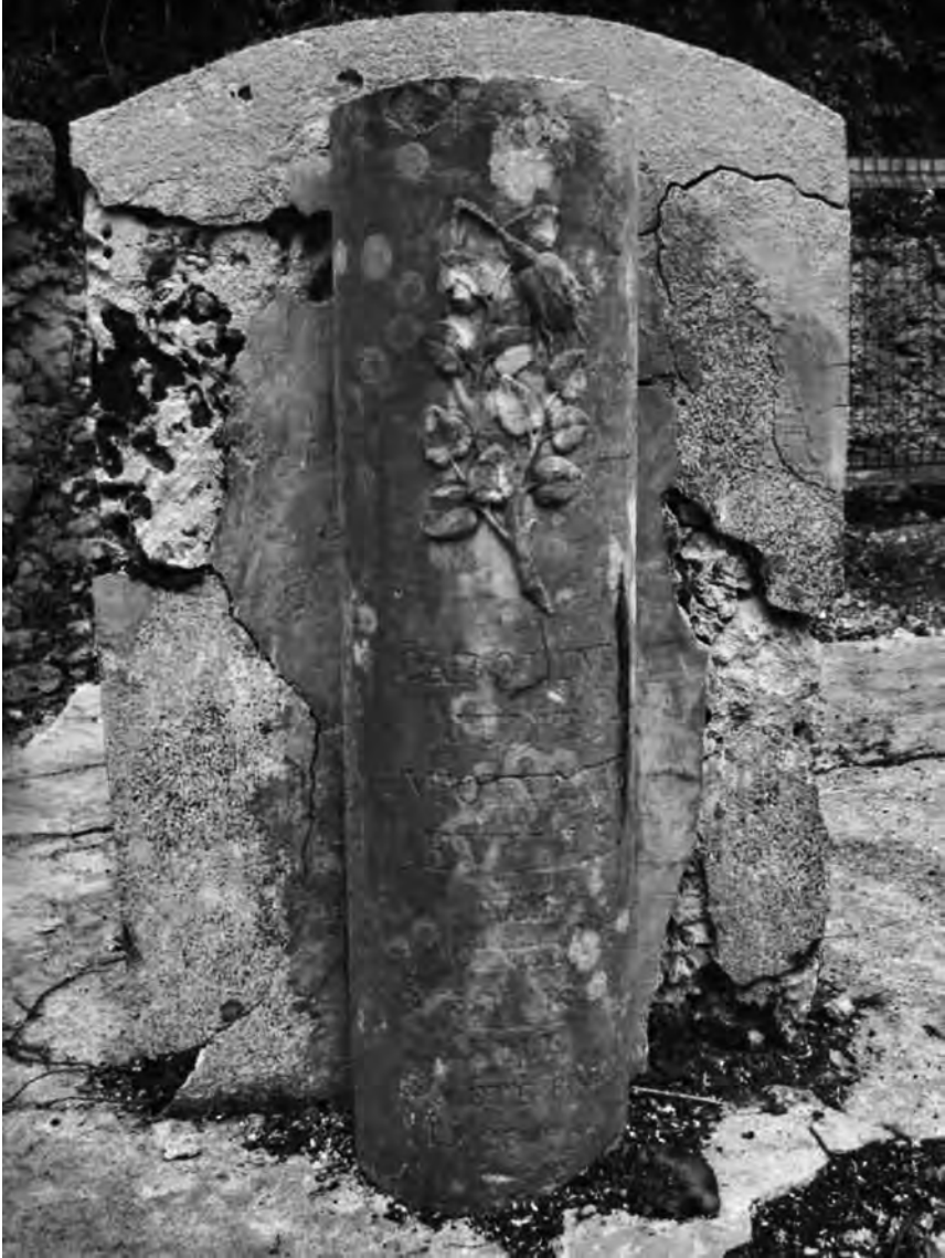
Fig. 15 – Enclos n° 2, tombe d'Antoinette DEVILLE, colonne portant l'inscription.

La rose à la tige brisée est un symbole funéraire fréquent. Elle témoigne d'une jeune fille morte en bas-âge.