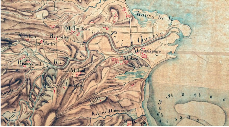
Habitation Lagrange sur la carte des ingénieurs du Roi (1765-1766) 3

Les archéologues constatèrent que l'occupation précolombienne se concentrait sur le sommet du morne. La partie fouillée étant l'extrémité d'un village plus conséquent. Ce site d'habitat est matérialisé par des trous de poteaux d'envergure et de grandes fosses. L'occupation coloniale, recouvre cet habitat sur le sommet et s'étend en contrebas au pied du morne.