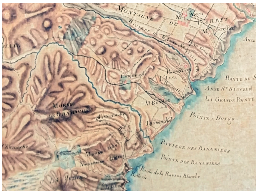
Situation de l'habitation Cantamerle extrait des cartes des Ingénieurs du Roi (1765-1766) 5