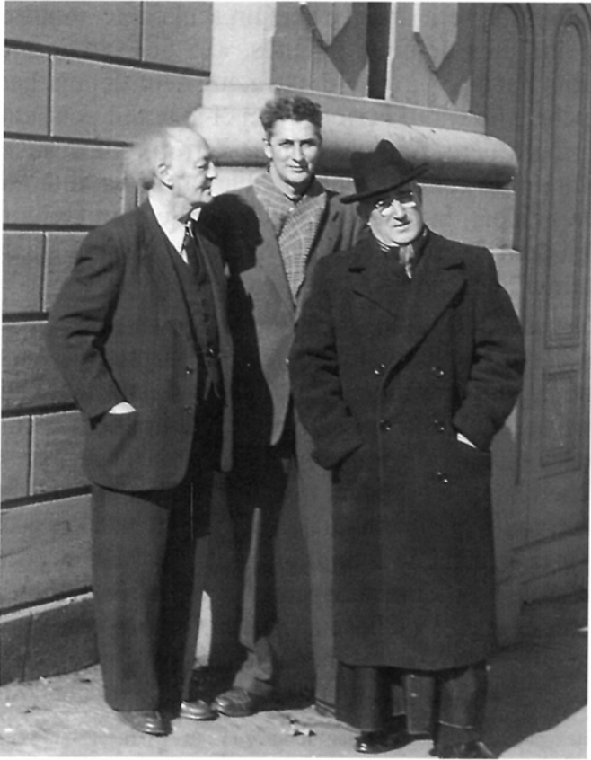
Marius Barbeau, Luc Lacourcière et Félix-Antoine Savard, rue de l'Université, Québec, vers 1950. MCC, cliché J-13918.

Brunswick, que Lacourcière et Savard connaissent depuis 1951 13 et de qui ils ont recueilli, dans son pays en 1952, cinq chansons, six contes et un reel à bouche 14 . Ce soir-là,