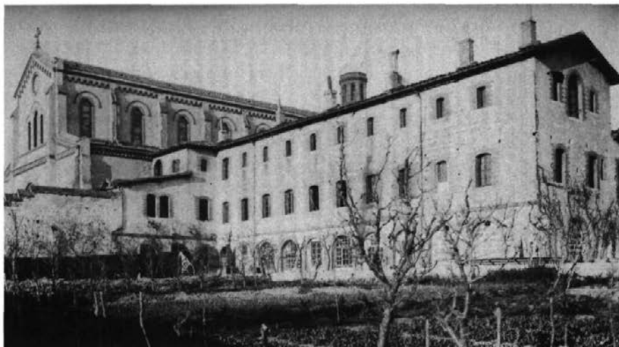
Nouveau couvent des capucins à Toulouse, construit en 1858.

séraphique destinées aux jeunes aspirants au sein de la communauté. Ces écoles dites d'enseignement libre sont tolérées en marge de l'école publique laïque instituée par Jules Ferry en 1881.