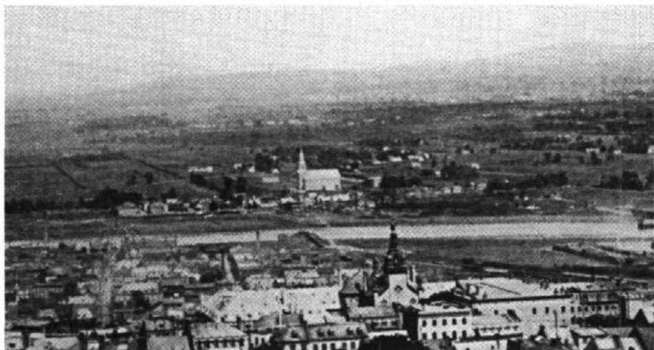
Limoilou en 1899, petit village aux portes de Québec, sur la rive gauche de la rivière Saint-Charles.