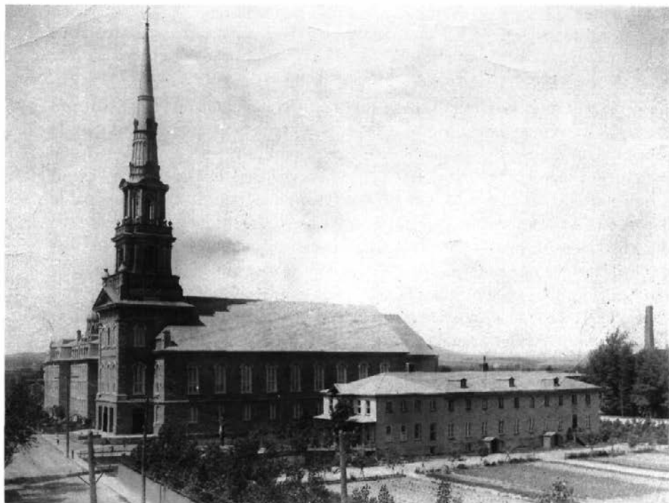
Église de Saint-Charles de Limoilou, telle que restaurée après l'incendie de 1899 (photo vers 1912).