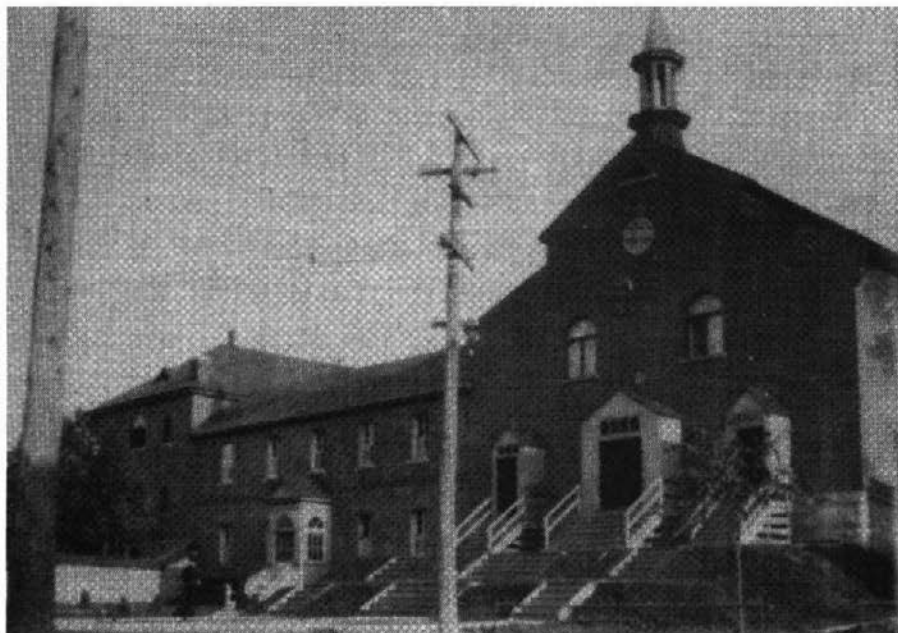
Premier couvent des capucins à Ottawa, construit en 1890-1891.