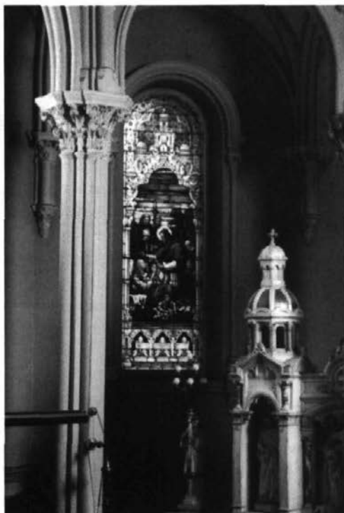
Un des vitraux de l'église Saint-Charles de Limoilou représentant l'assistance des capucins de Milan aux œuvres charitables de saint Charles Borromée en 1575-1576.