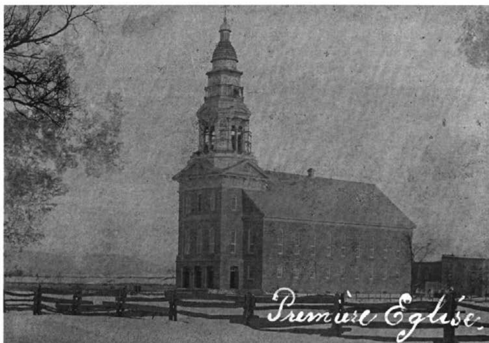
Église Saint-Charles de Limoilou, incendiée en décembre 1899.