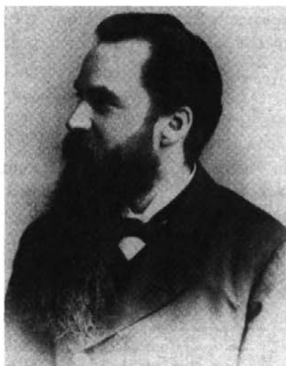
Guillaume Couture en 1888.

Contrairement à Montréal, je n'ai rencontré à Paris que des cœurs sympathiques. À Montréal, on me détestait. Singulier contraste. Si j'étais riche, le