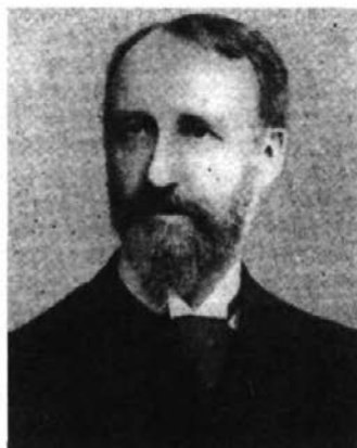
Théodore Dubois (1837-1924).