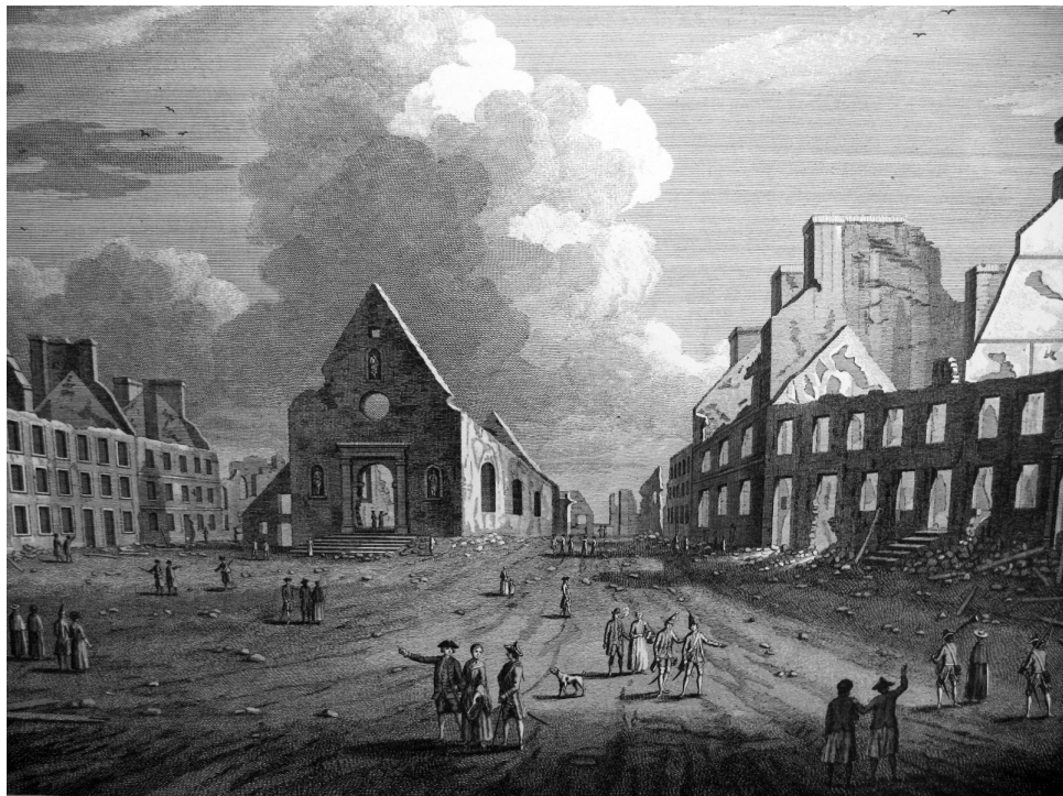
Ruines de l'église Notre-Dame des Victoires et de la Place Royale à Québec (détail). Paru dans Thomas Jefferys, The Natural and Civil History of the French Dominions, 1760.