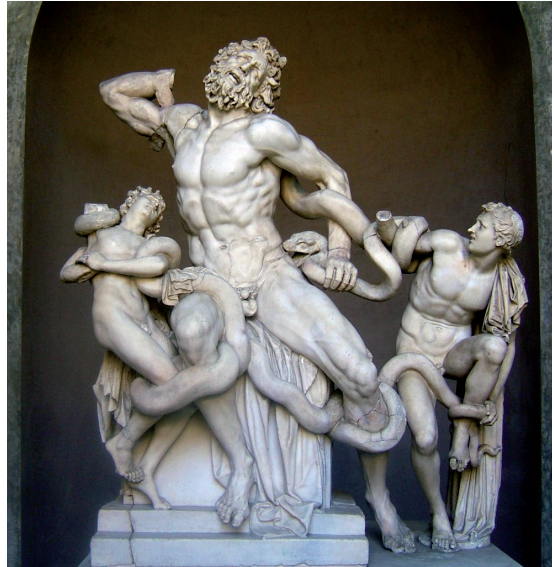
Fig. 4 Laocöon , marbre, Musée Pio-Clementino, Vatican.