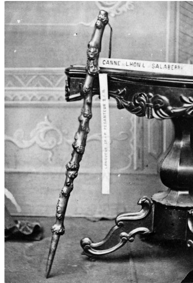
Fig. 9 Photographie non identifiée, Canne de Salaberry, Musée de la civilisation.