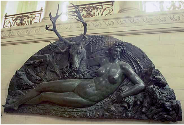
Fig. 6 Benvenuto Cellini (1500-1571), Nympha de Fontainebleau, 1542-1543, bronze, Musée du Louvre.

réputation ne s'est jamais tarie. Un deuxième nu féminin composait l'envoi impérial. La Nympha de Fontainebleau (1542-1543) de Benvenuto Cellini (1500-1572) (fig. 6) avait été réalisée pour orner la Porte dorée du château de Fontainebleau 44 . Finalement installée à Anet, elle fut déplacée au Louvre dès 1797. L'identification du cinquième moulage est incertaine. Le Catalogue de vente des plâtres du Louvre fournit la liste de trois candélabres qui sont disponibles 45 et aucun ne correspond au « Grand Candélabre de la Salle du Conseil ».