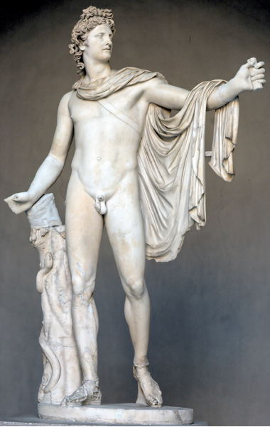
Fig. 3 Apollon du Belvédère , marbre, Musée Pio-Clementino, Vatican.