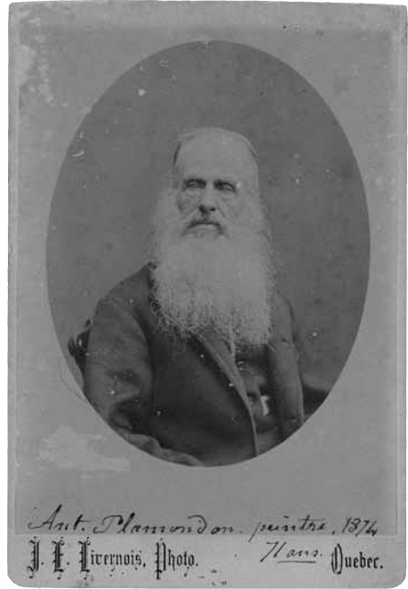
Antoine Plamondon photographié par J.-E. Livernois en 1874. Albumine argentique, papier collé sur carton (16,1 X 11 cm.) (Musée national des Beaux-Arts du Québec, achat 2005.15)

En dépit de ses études et de sa pratique, Plamondon manifeste peu d'intérêt intellectuel. Il ne se départit jamais d'une pensée royaliste et conservatrice qu'il développe lors de son séjour en France sous Charles X. Ses textes suggèrent une méconnaissance de la langue au service d'un style souvent ampoulé, d'un ton qui affiche sa supériorité et un tempérament égocentrique.