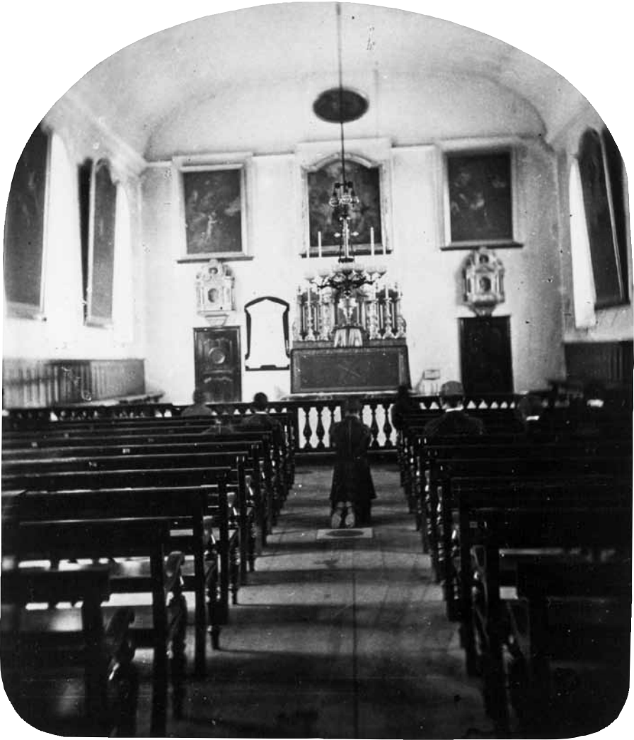
Vue intérieure de la Chapelle du Séminaire de Québec, avant 1884. Papier albuminé.

On croirait lire dans cette exhortation le conseil du peintre Nicolas Poussin à son ami Chantelou : « Lisez l'histoire avec le tableau 31 . »