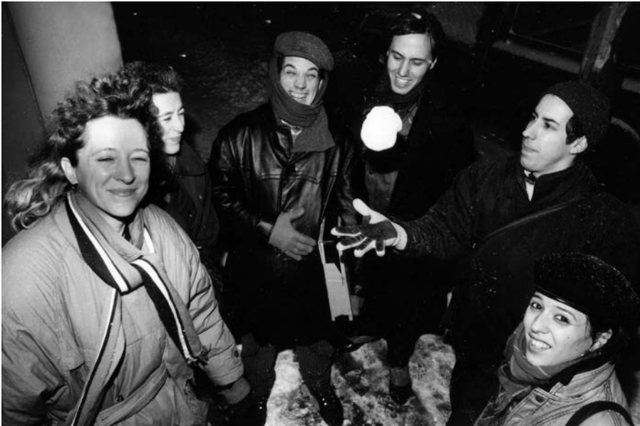
Quelques fondateurs de Musique Actuelle (début des années 1980).