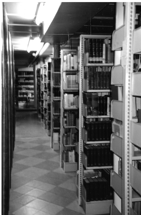
La bibliothèque des Capucins de Limoilou en 1992. D'abord installée au rez-de-chaussée du couvent, la bibliothèque fut déménagée au sous-sol dans l'ancien réfectoire vers 1990.

Dès la fondation de leur couvent de Limoilou en 1902, les Capucins ont rassemblé une bibliothèque qui, au fil des ans, a pris une certaine importance. Dans les procès-verbaux des premières visites pastorales régulières du vicaire provincial de l'Ordre, on note des prescriptions relatives à la bibliothèque conventuelle, enjoignant de dresser un catalogue de la bibliothèque (1911) ou de construire de nouveaux meubles à rayons pour les collections (1916) 17 . À son apogée, à la fin du XX e siècle, cette bibliothèque a compté environ 25 000 volumes et périodiques, dont la moitié sur des sujets de théologie, de philosophie ou de religion. L'autre moitié couvrait tous les thèmes d'une collection académique : sociologie, droit, sciences, beaux-arts, littérature, géographie, politique, histoire. Cette bibliothèque conventuelle pouvait surprendre par la qualité, l'étendue