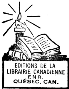
Sceau de la Librairie canadienne qui était située à l'angle du chemin de la Canardière et de la 4 e Avenue, à Limoilou. On le retrouve estampillé sur certaines brochures de la collection des Capucins. (photo de l'auteur)

On trouve dans la collection beaucoup d'imprimés produits à Ottawa, où les Capucins sont arrivés en 1890, grâce au parrainage de M gr Duhamel, par exemple quelques numéros de la revue Le Foyer domestique publiés en 1876-1877, qui portent sur des sujets divers : religion, littérature, histoire, agriculture, éducation et tempérance. On peut parfois identifier la provenance de brochures européennes ou canadiennes lorsqu'elles portent le sceau du libraire qui les a vendues. Ce peut être la Librairie Garneau de Québec, la Librairie de l'Action catholique, la Librairie du Quartier Latin, rue Saint-Jean à Québec, la Librairie Notre-Dame, d'Oscar Masson, de Cambrai en France, ou celle de Mlle Charles à Toulouse ou tout autre qui témoigne de l'étendue du réseau d'approvisionnement des Capucins. Un certain nombre porte la marque de la Librairie canadienne, située à l'angle du chemin de la Canardière et de la 4 ème Avenue à Limoilou, que les pères devaient assurément encourager. On y vendait notamment des missels, des images pieuses et des articles de piété.