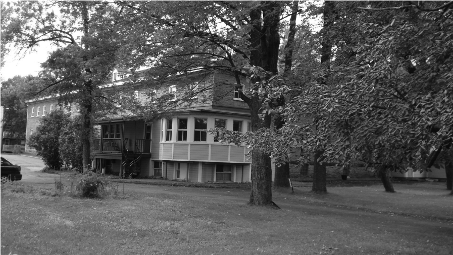
Le couvent des Capucins en 2015 vu du jardin.