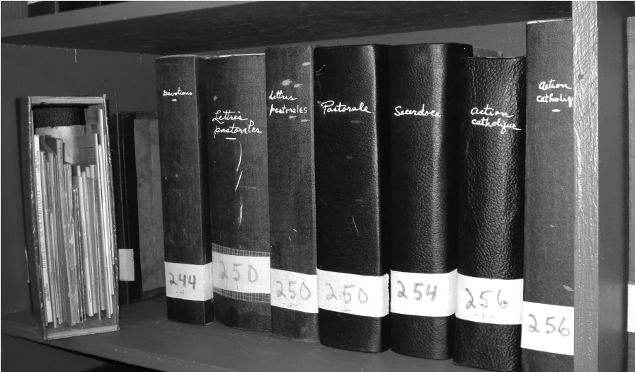
Quelques-unes des boîtes de brochures de la collection des Capucins de Limoilou.

et la variété de ses collections. Parallèlement à cette bibliothèque choisie, une collection de 2 500 brochures s'est constituée, formée de publications dont certaines remontent au XIX e siècle et qui s'est développée jusque vers 1980.