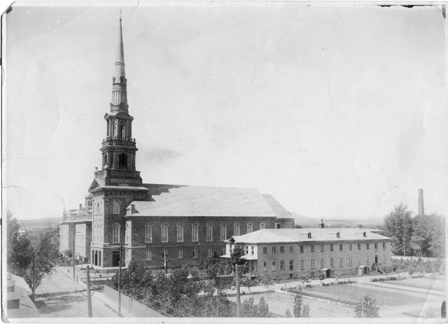
L'église Saint-Charles et le couvent des Capucins photographiés en 1912. On aperçoit à droite le grand jardin de la communauté.