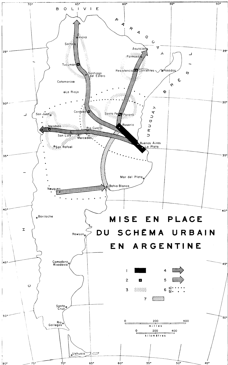
Figure 1 1. Guirlande urbanisée du littoral (ébauche d'une future mégalopolis ?) ; 2. Métropoles d'équilibre ; 3. Limites des micro-réseaux ; 4. Axes urbains traditionnels ; 5. Axe en puissance du Rio Negro ; 6. Zone à restructurer autour d'un schéma-urbain hiérarchisé : a) priorité 1 b) priorité 2 ; 7. Ceinture de noyaux urbains souhaitable (Rosario - Bahía Blanca).