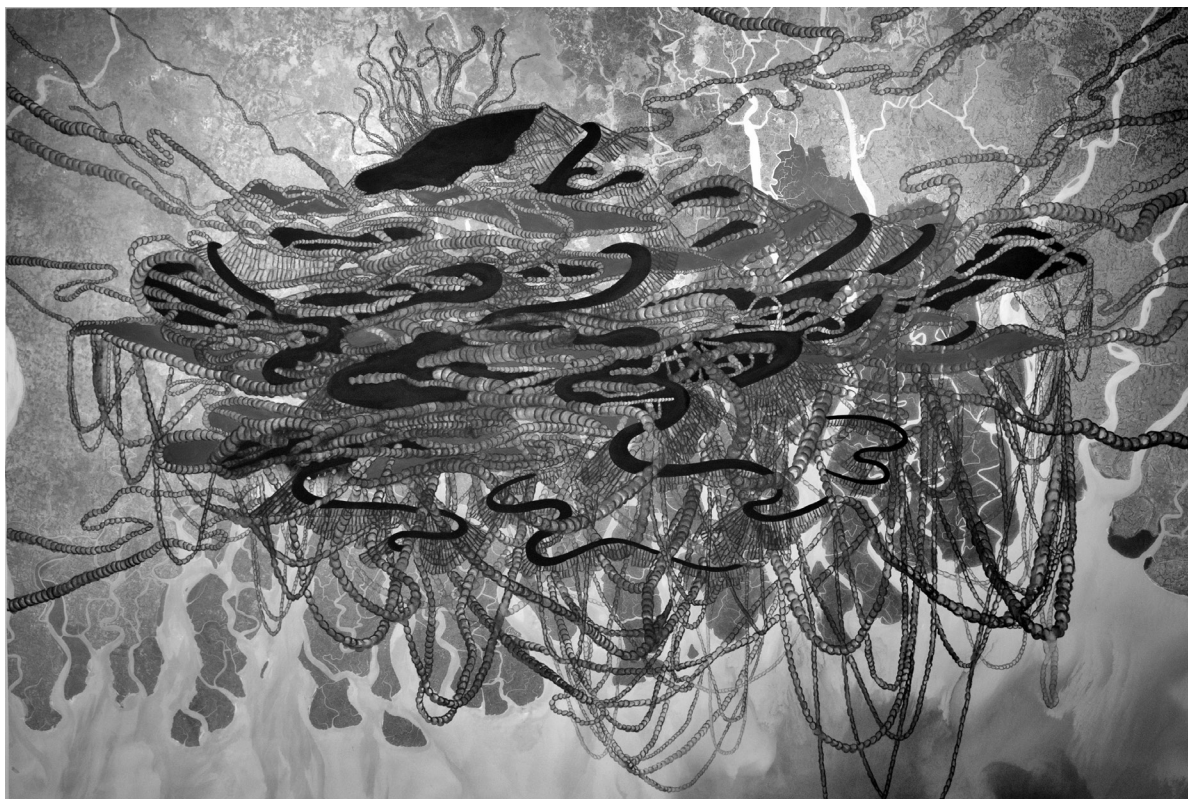
Catherine Bolduc, South Talpatti en lévitation au-dessus des Sundarbans , 2013. Impression numérique, peinture acrylique et aquarelle sur papier, 122 x 183 cm. Collection de la Banque Nationale.