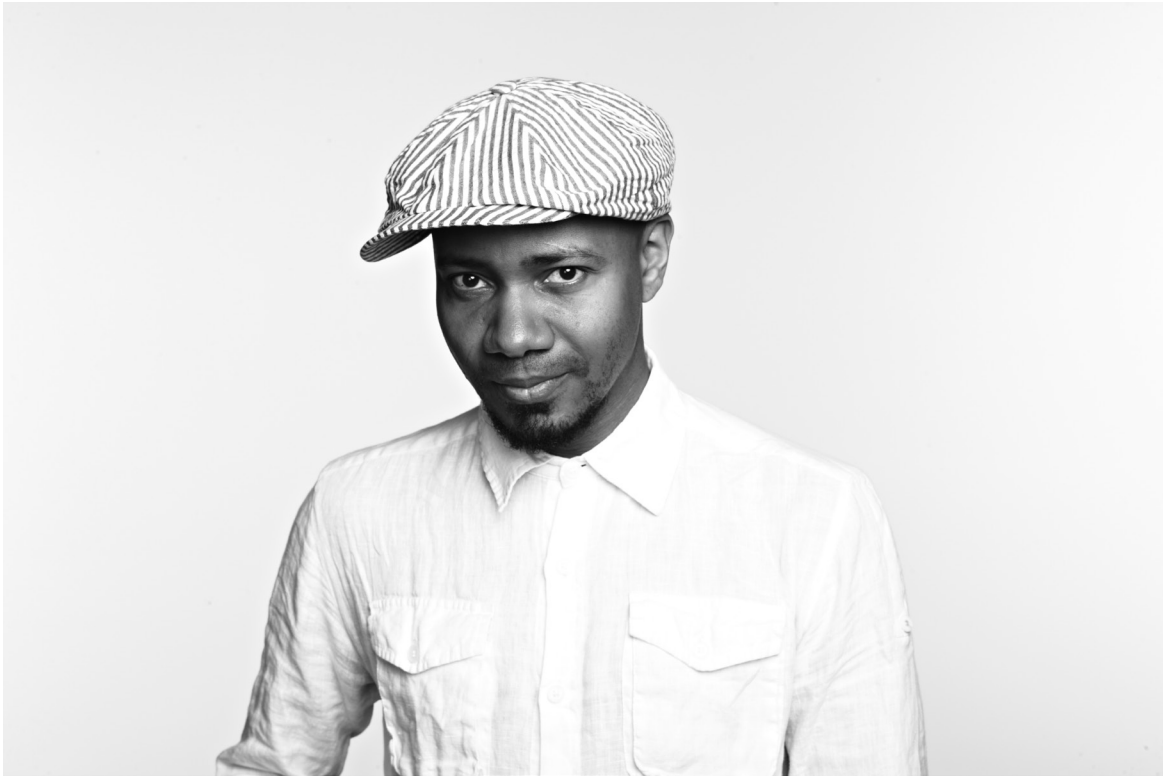
Portrait de Paul D. Miller (alias DJ Spooky)