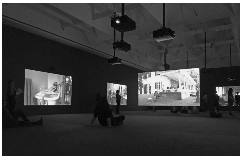
FIGURE 3 Extrait de l'installation The Visitors au MACM.

Le contexte de l'œuvre rappelle déjà la manière dont les disques sont enregistrés de nos jours : des musiciens isolés qui enregistrent leur trame séparément pour conserver le plein contrôle sur chaque instrument lors du mixage ; l'occupation de lieux mythiques à la réverbération unique et singulière ; l'aspect répétitif qui rappelle les nombreuses prises souvent requises pour obtenir la performance désirée. La dimension supplémentaire et nouvelle de cette œuvre est le mixage en temps réel ; mais elle n'existe que parce que l'image a un pouvoir d'attraction qui nous oblige à constamment réentendre la musique. Chaque déplacement, chaque mouvement de la tête augmente ou diminue la