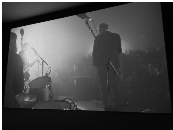
FIGURE 1 Extrait de l'installation A Lot of Sorrow au MACM.

Par une répétition démesurée, combinée avec un dispositif particulier de projection audiovisuelle, Kjartansson fait émerger l'aspect live d'une performance à même un enregistrement audiovisuel et restitue à la musique une certaine souveraineté.