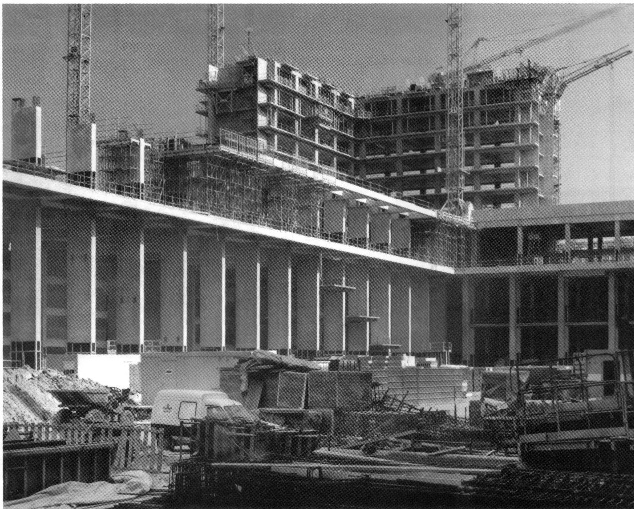
Vue partielle de l'état des travaux au 31 mars 1993.

lancé en direction des centres documentaires régionaux qui, sous la dénomination de «pôles associés», sur la base d'une répartition des crédits d'acquisition et d'une spécialisation, deviendront les partenaires à part entière de la Bibliothèque de France. Enfin la numérisation mettra des ressources documentaires progressivement croissantes à la disposition de tous les usagers du réseau.