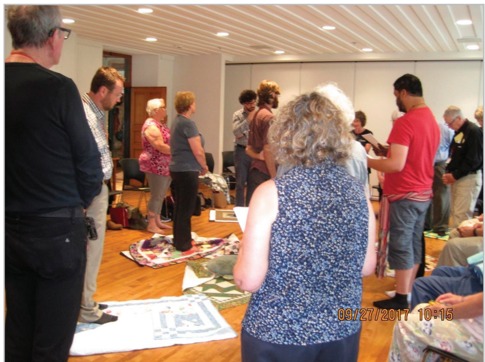
Figure 1. Groupe vivant l'exercice des couvertures

La figure 1 donne un aperçu de l'ambiance durant l'exercice des couvertures. Celui-ci se déroulait dans le cadre d'un colloque d'animateurs et d'animatrices de vie pastorale dans les locaux du Monastère des Augustines de Québec.