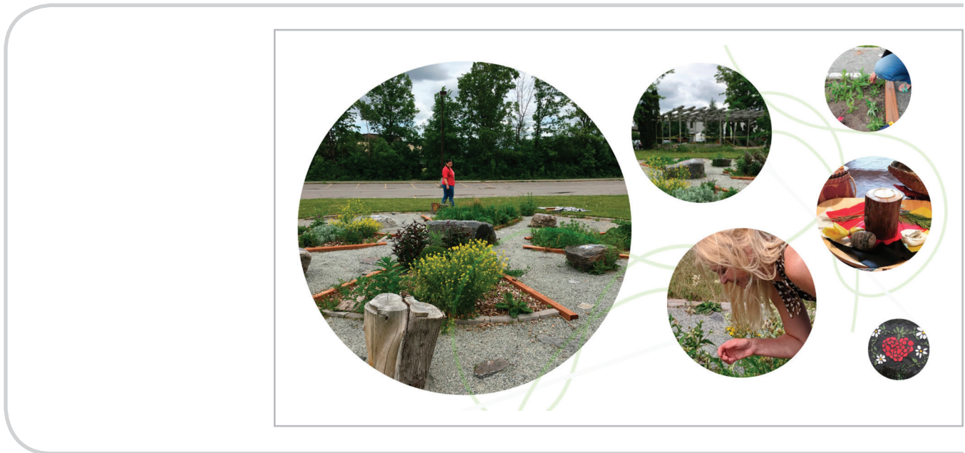
Figure 1. Kitigònens

a surgi, celle de mettre en scène les contraintes et limites de ces rencontres avec les participantes aînées, enseignantes, agente de liaison et artiste Anishinabeg dans le cadre de cette étude. Mes recommandations sont présentées sous la forme de figures de synthèse considérant la mise en application d'une pédagogie de la réconciliation à visée décoloniale dans les collèges (Figures 1, 2 et 3). Elles sont formulées comme une invitation: que pouvons-nous faire et qui pouvons-nous être, comme pédagogues de la réconciliation dans les collèges? La Figure 1 évoque certaines dimensions de la réciprocité envers les langues autochtones dans la pédagogie de la réconciliation, tout comme la présence d'un jardin autochtone – espace hors texte - dans le contexte colonial d'un collège.